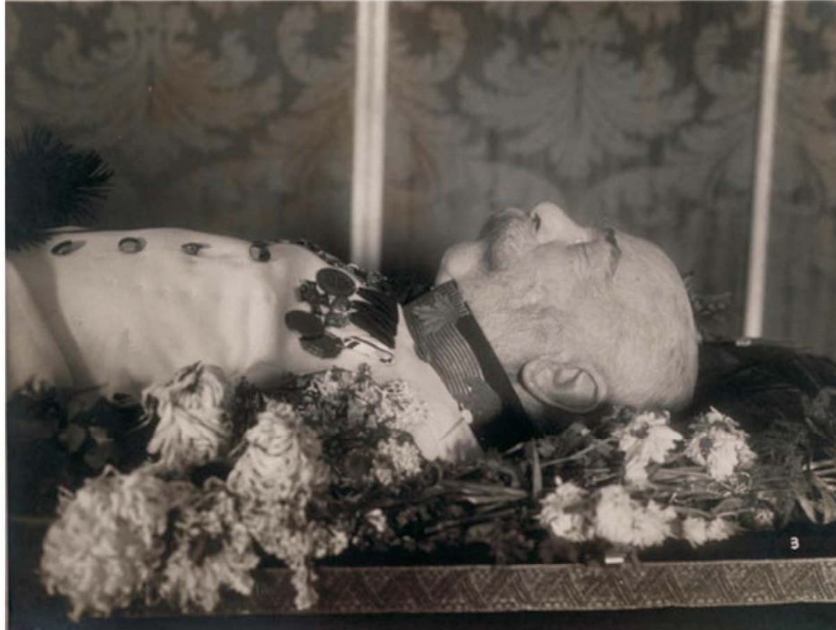
Aufbahrung Kaiser Franz Josephs I.