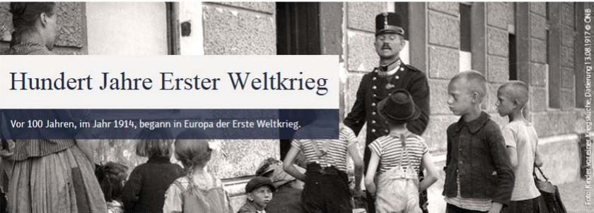
Demokratiewebstatt > Thema > Thema: Hundert Jahre Erster Weltkrieg