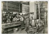
Überleben im Krieg > weiterlesen