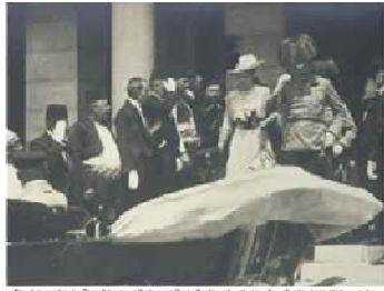
The assassination of the heir-apparent of the Austro-Hungarian Empire, Franz Ferdinand, and his wife, Sophie, in Sarajevo on June 28, 1914.