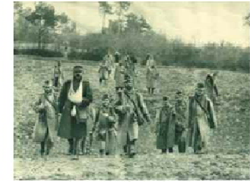
Heimkehrende Soldaten