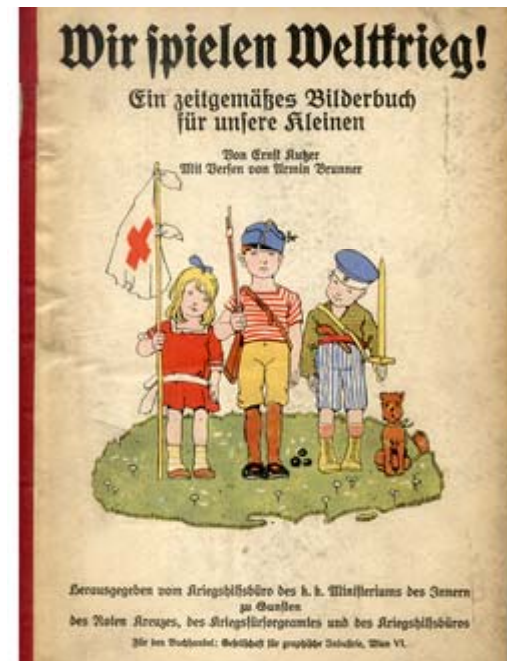
„Wir spielen Weltkrieg!“ – Auch in Bilderbüchern wurden bereits Kleinkinder zum Kriegspielen aufgerufen.

Das Kriegspressequartier (KPQ) des Armeeoberkommandos war die zentrale Propagandaeinrichtung Österreich-Ungarns. Nahezu jede Information über den Krieg wurde vom KPQ gesteuert und zensiert .