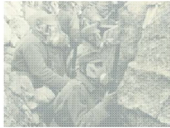
Deutscher Soldatengeneral bei der Schließung der Waffenruhe während der ersten Weltkriege in Deutschland