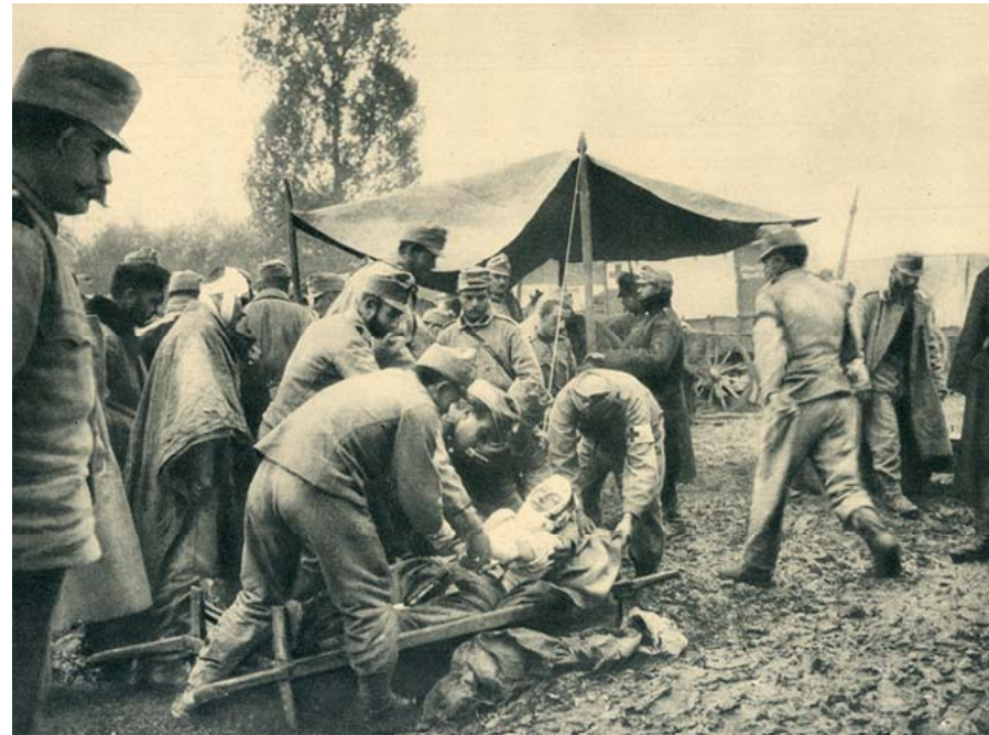
Verwundete auf einem Erstversorgungsplatz