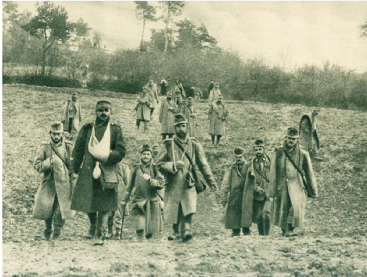
Heimkehrende Soldaten