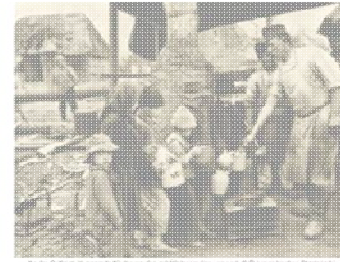
Die deutsche Kriegserklärung an Frankreich am 3. August 1914.