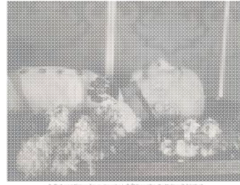
Aufhebung des Kriegszustandes am 11. November 1918.