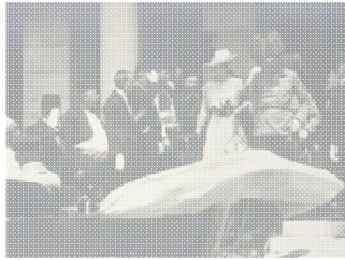
Die internationale Friedenskonferenz in Paris, Frankreich, im Jahre 1919. Siehe auch: Wikipedia.de, Konferenz von Versailles in Deutschland, demofocus.de