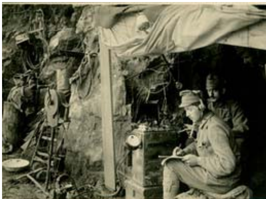
Auch in Schützengraben waren Funk- und Telegrafstationen eingerichtet.