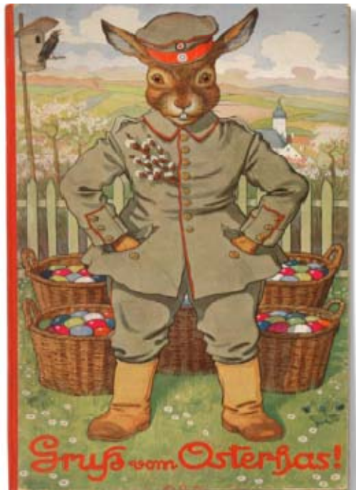
Gruß vom Osterhas!

In den Jahrzehnten vor dem Ersten Weltkrieg lagen die großen europäischen Mächte im Rüstungswettstreit. Das Militär gewann an Einfluss. Herrscher zeigten sich gerne in Uniform und Militärparaden waren Feste für das ganze Volk.