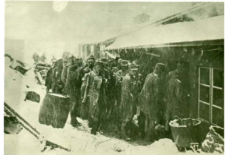
Verpflegung von Soldaten im Schneesturm an der Tiroler Hochgebirgsfront

Besonders kräfteaubend war der Stellungskrieg an der Südfront im Hochgebirge, den Dolomiten.