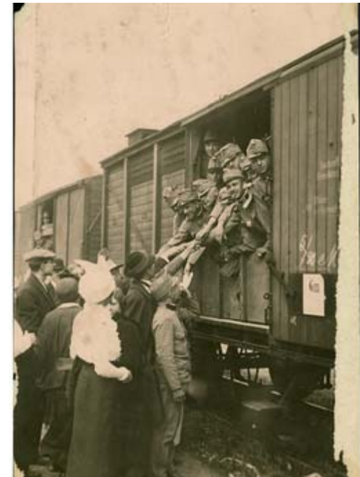
Soldaten bei der Abfahrt von Wien zum serbischen Kriegsschauplatz

Nur ganz wenige erhoben ihre Stimmen für den Frieden. Bertha von Suttner ist bis heute die bekannteste Figur der österreichischen Friedensbewegung. 1889 erschien ihr Roman „ Die Waffen nieder “.