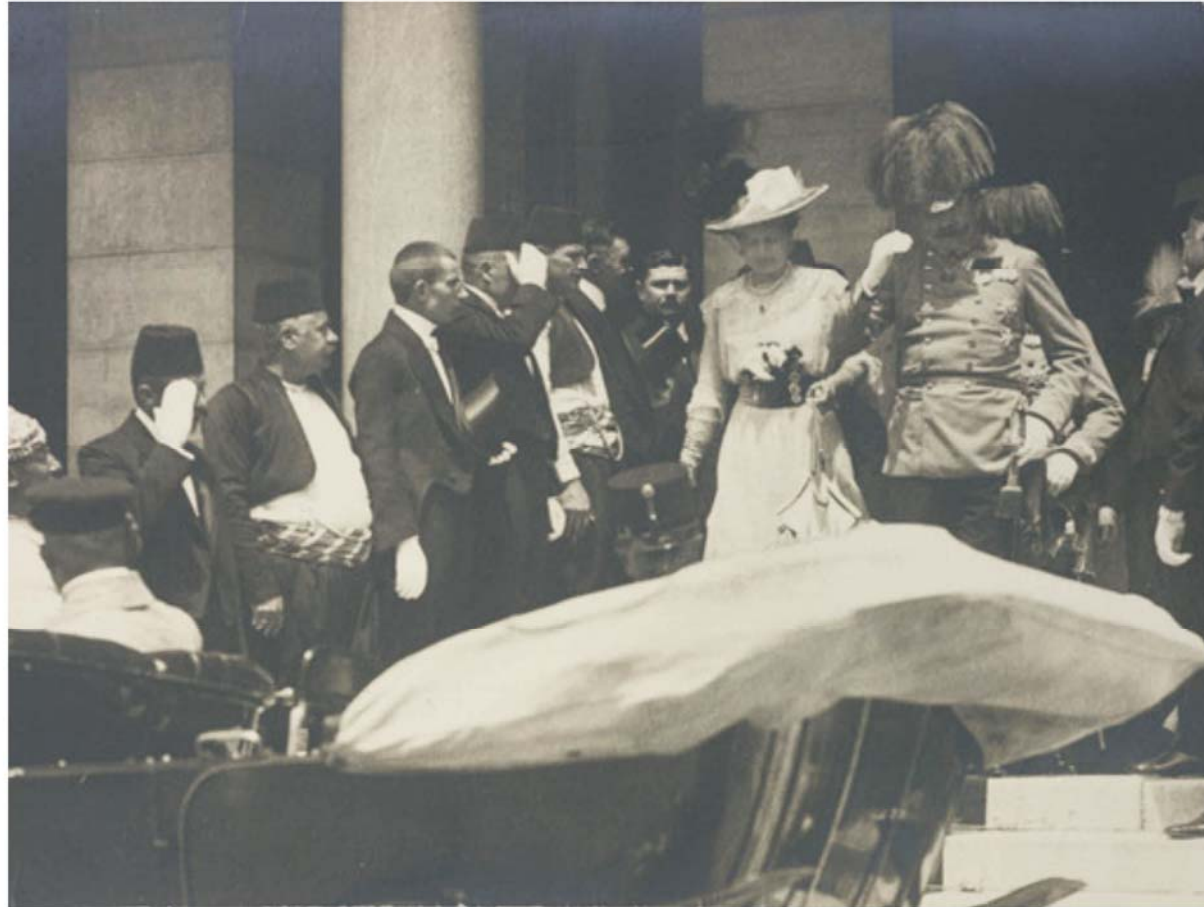
Das österreichische Thronfolgerpaar Erzherzog Franz Ferdinand und seine Frau Sophie beim Verlassen des Rathauses in Sarajevo knapp vor dem Attentat.