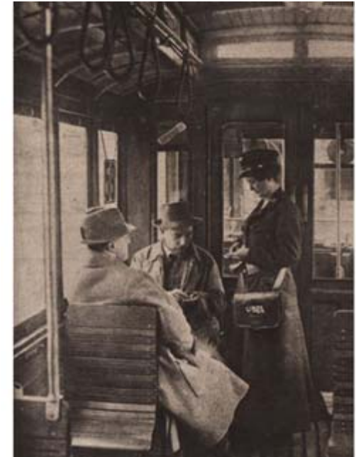
Während des Ersten Weltkriegs als Schaffnerinnen eingesetzt, mussten die Frauen in den Jahren danach diesen Beruf meist wieder aufgeben.