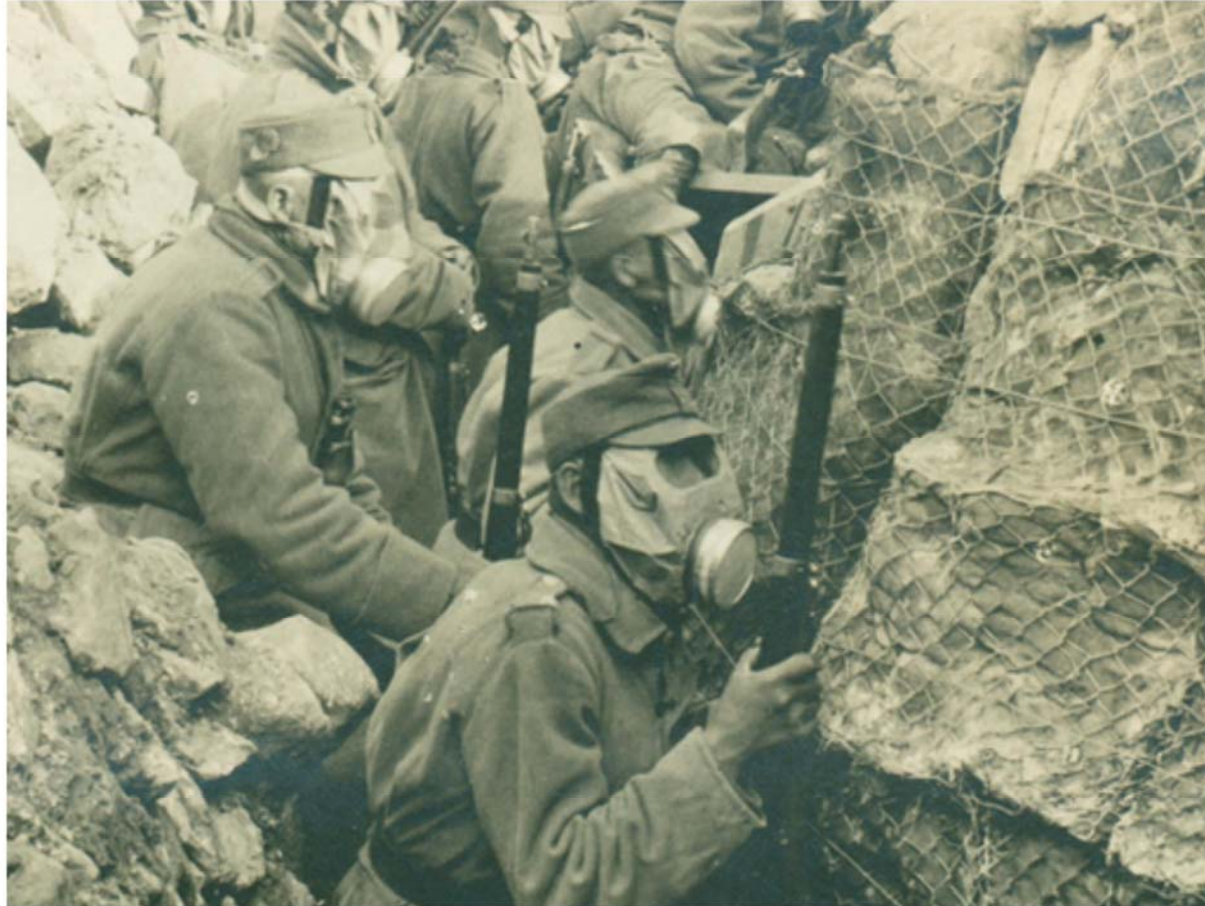
Soldaten im Schützengraben an der Südwestfront (am Isonzo) schützen sich mit Gasmasken vor einem bevorstehenden Gasangriff