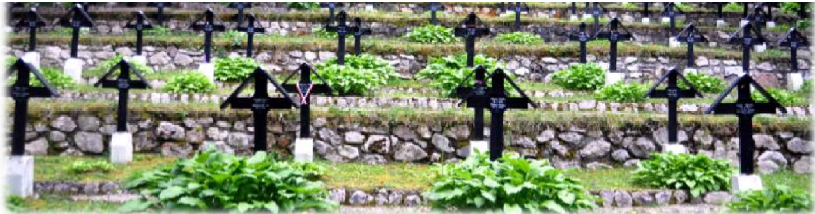
Soldatenfriedhof aus dem Ersten Weltkrieg in den Dolomiten Südtirols (Naßwand-Toblach-Monte Piana). 1.259 Soldaten unterschiedlicher Nationalitäten liegen hier begraben.

HistorikerInnen sprechen auch von der Urkatastrophe des 20. Jahrhunderts.