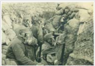
Im Kriegsverlauf > weiterlesen