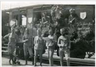
Von Sarajevo zum Flächenbrand > weiterlesen