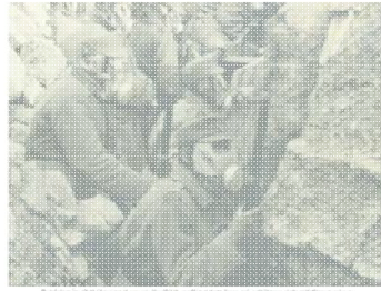
Die deutsche Kriegserklärung an Serbien am 7. Juli 1914.