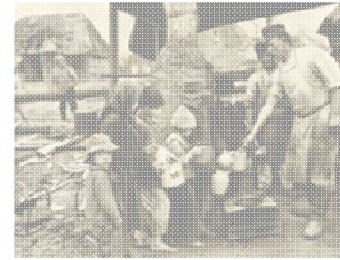
Kaiser Carl IV. Kaiserin Elisabeth werden in Wien verhaftet während