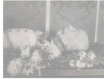
Aufhebung Kaiser Prinz erheben