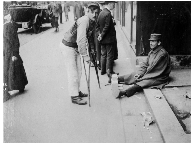
Nach dem Ersten Weltkrieg prägten Kriegsinvaliden das Stadtbild von Wien.