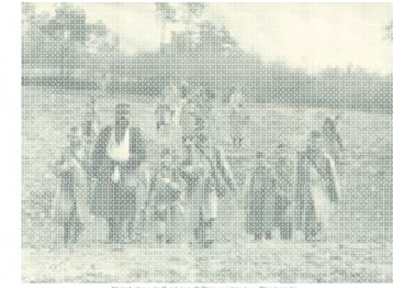
Die deutsche Kriegserklärung an Russland am 1. August 1914.