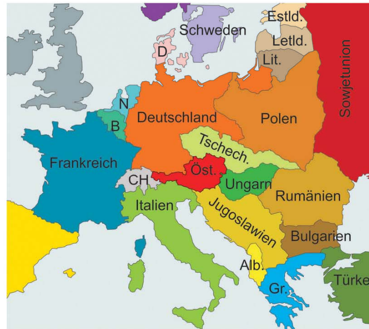
Europa nach 1920

Schematisch gezeichnete Karten Europas vor und nach dem Ersten Weltkrieg.