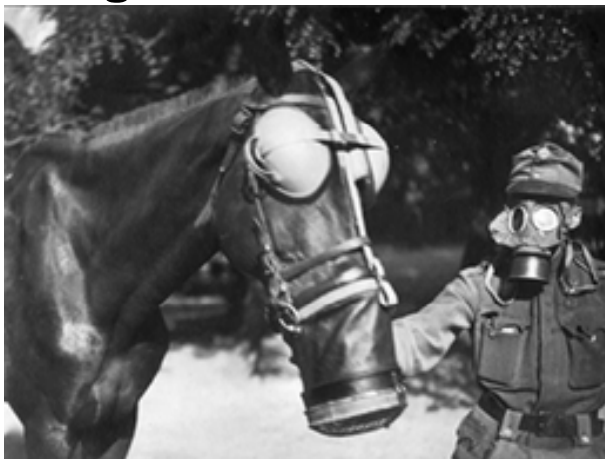
Soldaten mussten sich und ihre Pferde mit Gasmasken vor Giftgasangriffen schützen