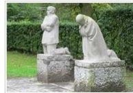
Der Erste Weltkrieg und seine Folgen > weiterlesen