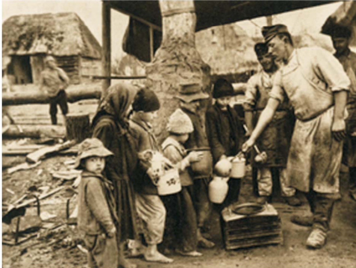
An der Ostfront: Hungernde Kinder werden mit Küchenresten versorgt.