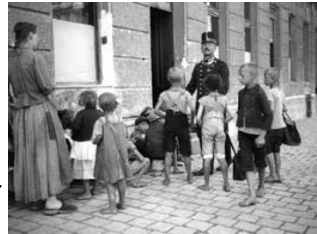
Kinder vor einer Kriegsküche in Wien im August 1917