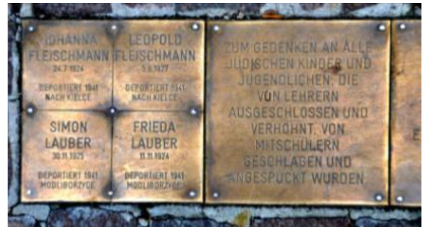
Gedenktafeln in der Kl. Sperlgaße in Wien II, Foto (c) Franz Stürmer

Kinder dieser Minderheiten waren oft Ziel von Spott, Erniedrigungen und willkürlicher Gewalt.