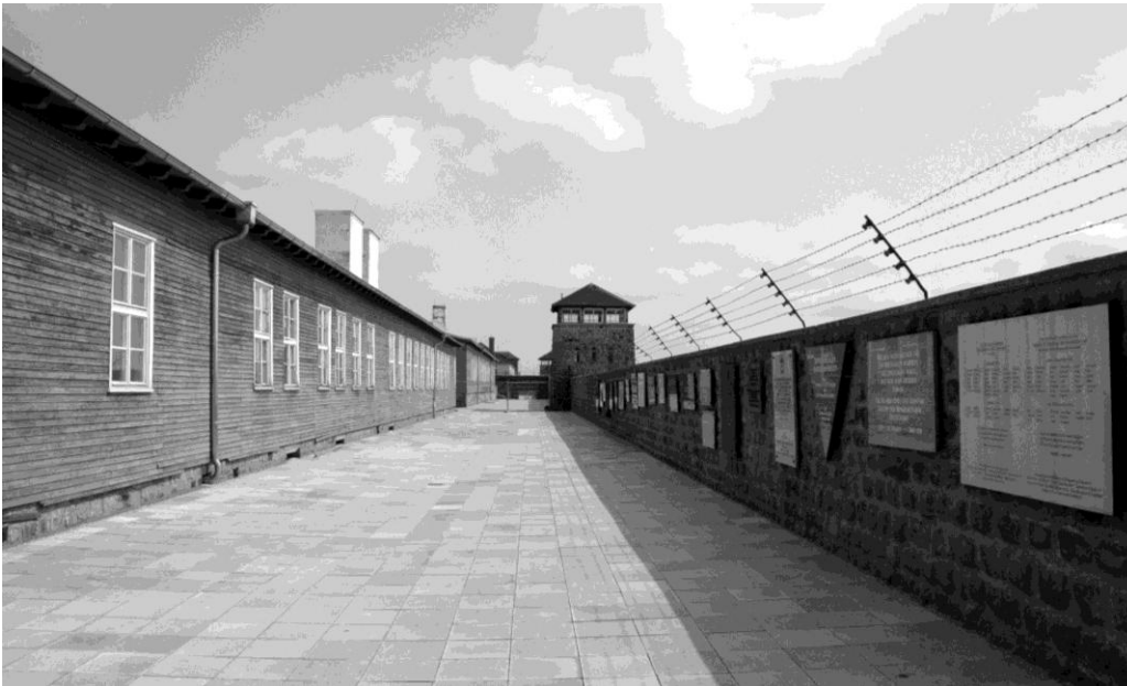
Blick ins KZ Mauthausen heute

Schon im Mai war die Arbeit in diesem Steinbruch unter der Leitung der SS mit Zivilarbeitern begonnen worden.