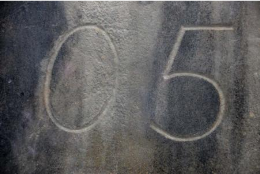
Symbol O5 auf dem Stephansdom in Wien, Foto: © Franz Stürmer

Ein Hinweis: es ist verschlüsselt und steht für Österreich!