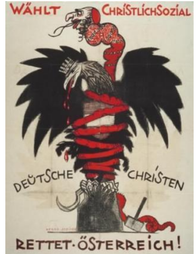
Wahlwerbung der Christlichsozialen Partei