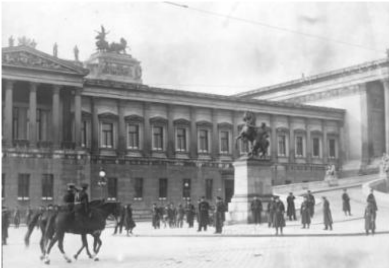
Ausschaltung des Parlaments

Das führt 1934 zum Bürgerkrieg. Die sozialdemokratische Partei wird verboten.