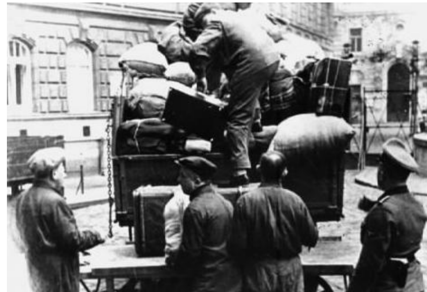
Zur Deportation gezwungene Jüdinnen und Juden beim Aufladen ihrer Gepäckstücke in der Kleinen Sperlasse in Wien

Zwangsdeportation von Jüdinnen und Juden, Wien II