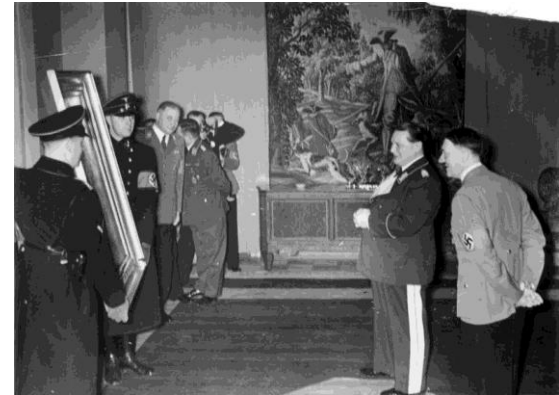
Hitler schenkt Ministerpräsident Göring anlässlich seines 45. Geburtstags ein Gemälde