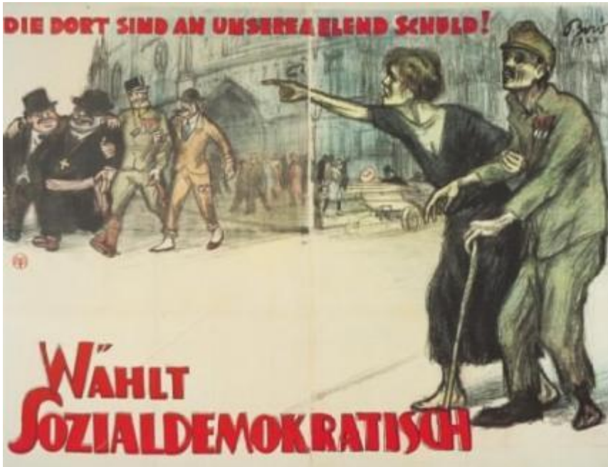
Wahlwerbung der Sozialdemokratischen Arbeiterpartei Deutschösterreichs, Foto c ÖNB