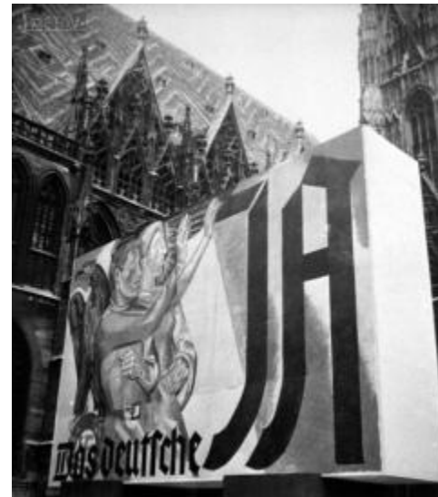
Nationalsozialistisches Propagandaplakat: "Das deutsche Ja" für die Volksabstimmung über den Anschluss Österreichs an das Deutsche Reich am 10.04.1938 vor dem Wiener Stephansdom

Ergebnis: 99,75% Ja-Stimmen für den „Anschluss“.