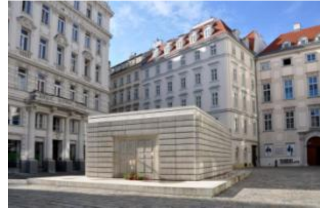
Das Mahnmal für die österreichischen Opfer der Shoah am Wiener Judenplatz, Rachel Whiteread, errichtet 2000

Wenn wir uns an die Geschichte erinnern, an all die Opfer und schrecklichen Ereignisse, was können wir heute daraus lernen?