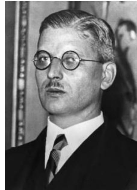
Portrait von Bundeskanzler Kurt Schuschnigg

Schuschnigg glaubt an ein „Ja“ für ein unabhängiges Österreich bei der Befragung, da auch die verbotene sozialdemokratische und kommunistische Opposition zur Unterstützung bereit ist.