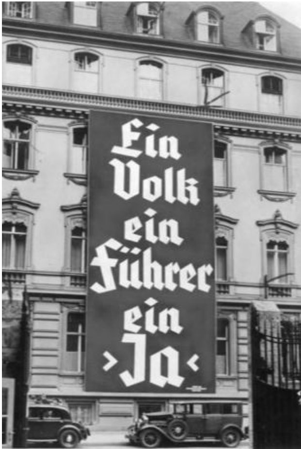
Wahlplakat der NSDAP zur Reichstagswahl