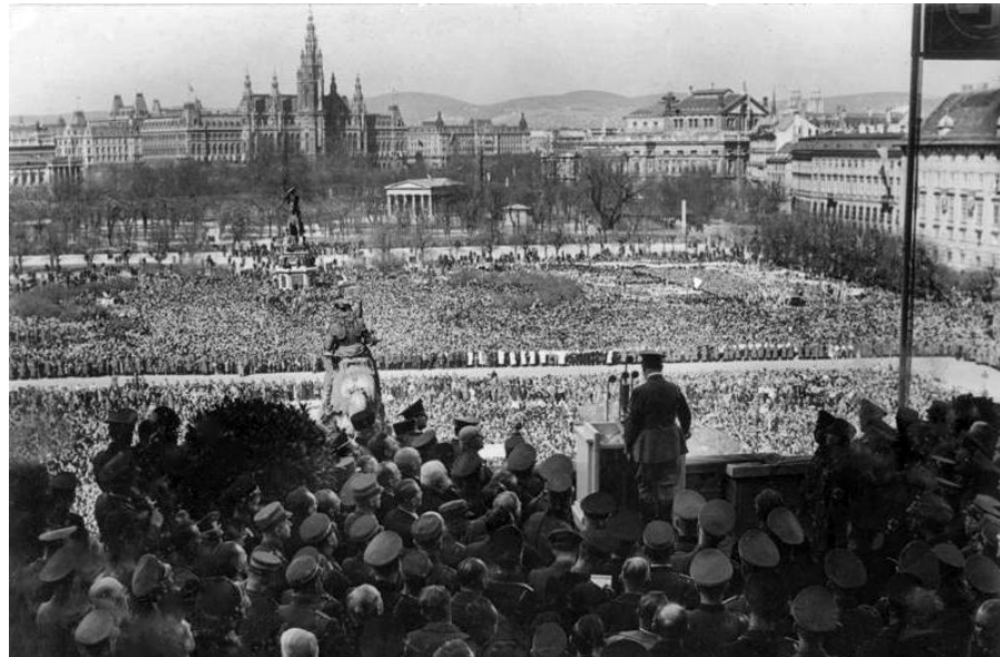
Ansprache Adolf Hitlers am 15. März 1938 auf dem Heldenplatz in Wien

Hitler hält auf dem Heldenplatz in Wien vor unzähligen Menschen eine Rede und verkündet „den Eintritt meiner Heimat in das Deutsche Reich“.