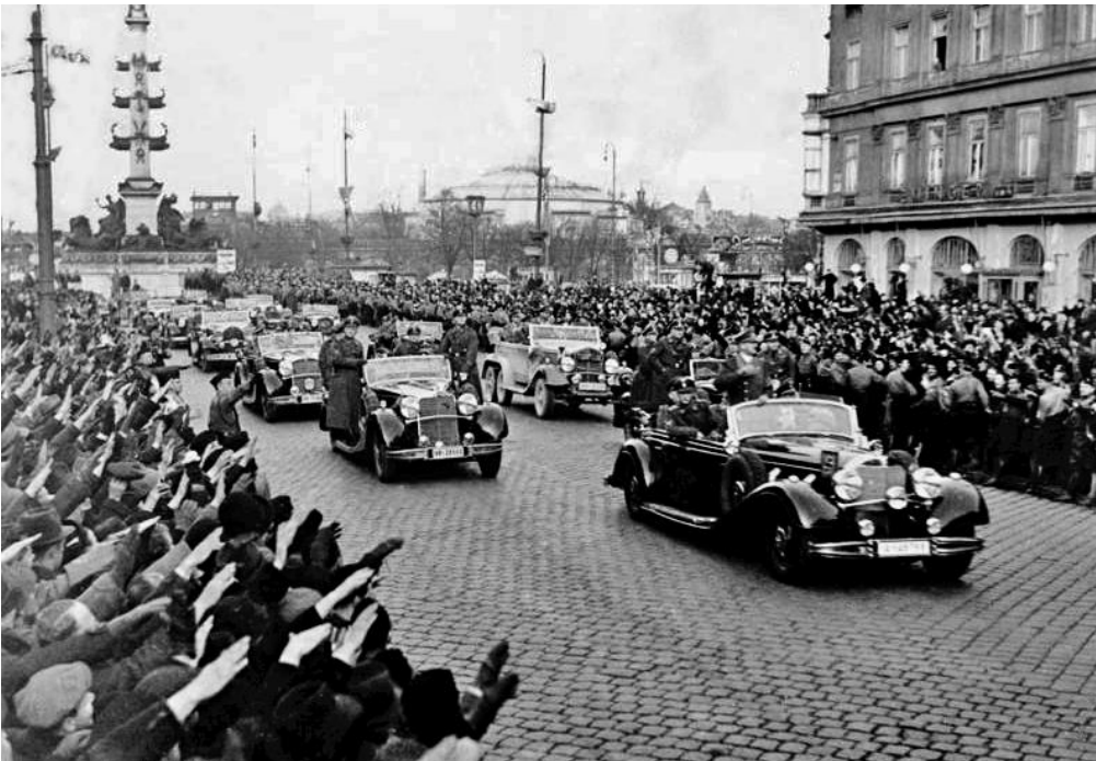
Einfahrt Hitlers am 15. März vom Praterstern (mit Tegetthoff-Denkmal) in die Praterstraße, Wien

65.000 Mann der deutschen Wehrmacht und Polizei marschieren in Österreich ein. Sie werden von großen Teilen der Bevölkerung mit Jubel empfangen.