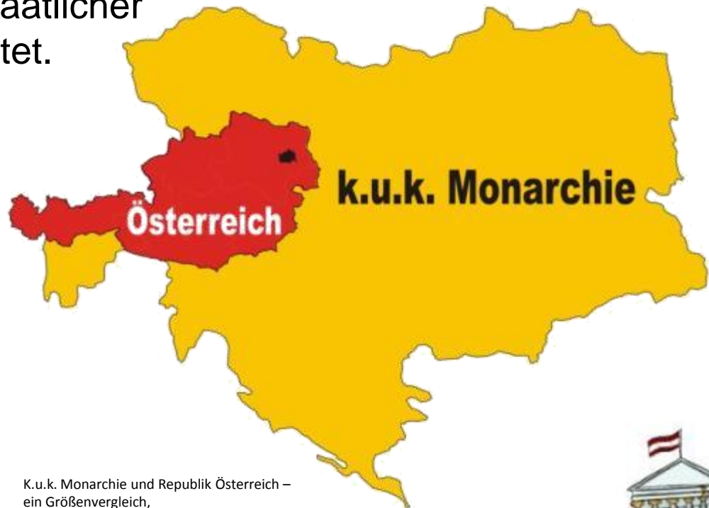
K.u.k. Monarchie und Republik Österreich – ein Größenvergleich, Grafik: © Franz Stürmer