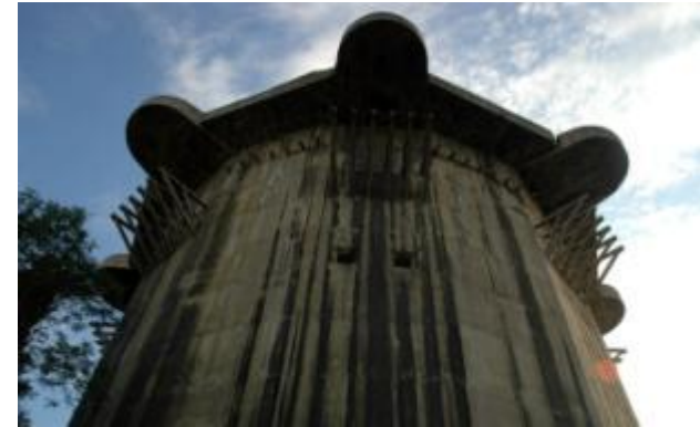
Flakturm in Wien, Augarten, Foto: © Franz Stürmer