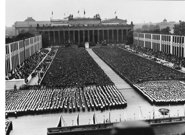
Olympiade 1936

Volksempfänger waren „Radios für jeden Haushalt“ – im Auftrag des NS-Regimes entwickelt und kostengünstig. Damit erreichte die NS-Propaganda jede Familie.