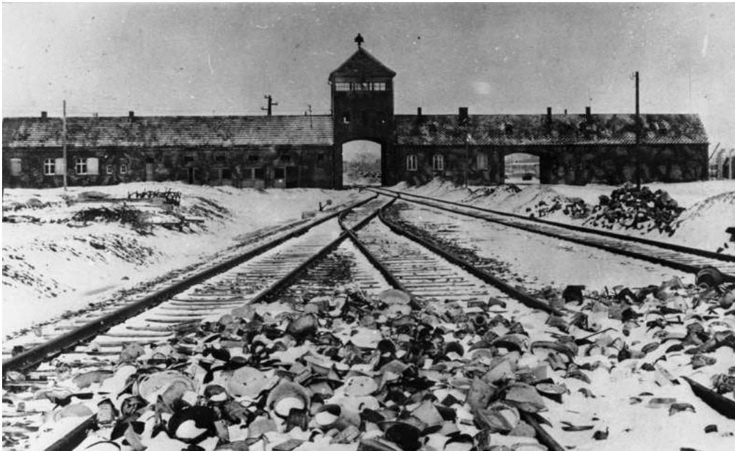
Die Einfahrt zum KZ Auschwitz

Für die Durchführung wurden eigene Vernichtungslager (Auschwitz-Birkenau, Treblinka, Sobibor, Chelmno, Belzec oder Majdanek) errichtet. Meist dienten eigens konstruierte Gaskammern zur Ermordung der Deportierten.