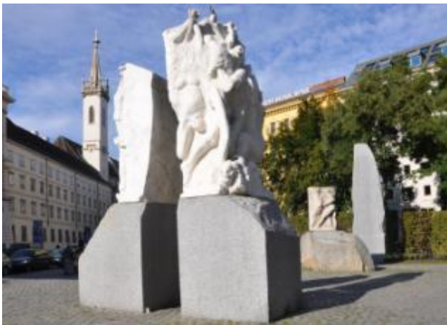
Mahnmal gegen Krieg und Faschismus am Wiener Albertina- platz, Alfred Hrdlicka, errichtet 1988, Foto: © Franz Stürmer

Der Blick in die Vergangenheit zeigt uns Wege in die Zukunft. Niemals vergessen!