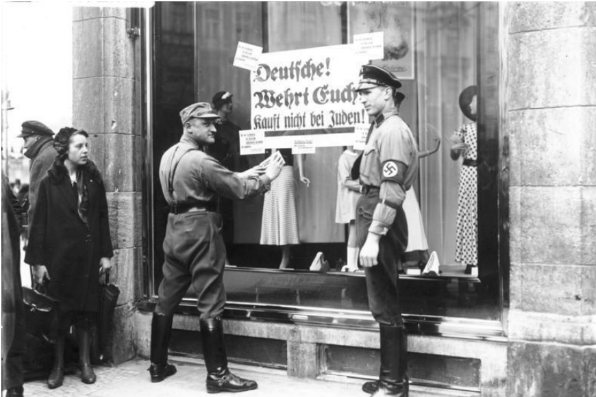
NS-Boykott gegen jüdische Geschäfte in Berlin

In wenigen Monaten erreicht Hitler durch Erlass von Gesetzen sowie mit Terror und Gewalt die Alleinherrschaft der NSDAP. Politische GegnerInnen werden inhaftiert / ermordet.