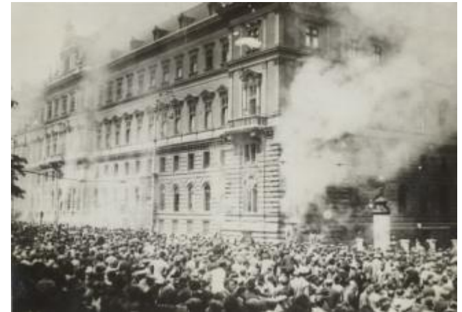
Brand des Justizpalastes in Wien am 15. Juli 1927 Menschenmenge vor dem brennenden Justizpalast.

Der Ausgang des Prozesses um die Tötung Unschuldiger bei einer Veranstaltung in Schattendorf führt zu Demonstrationen und zur Stürmung des Justizpalastes.