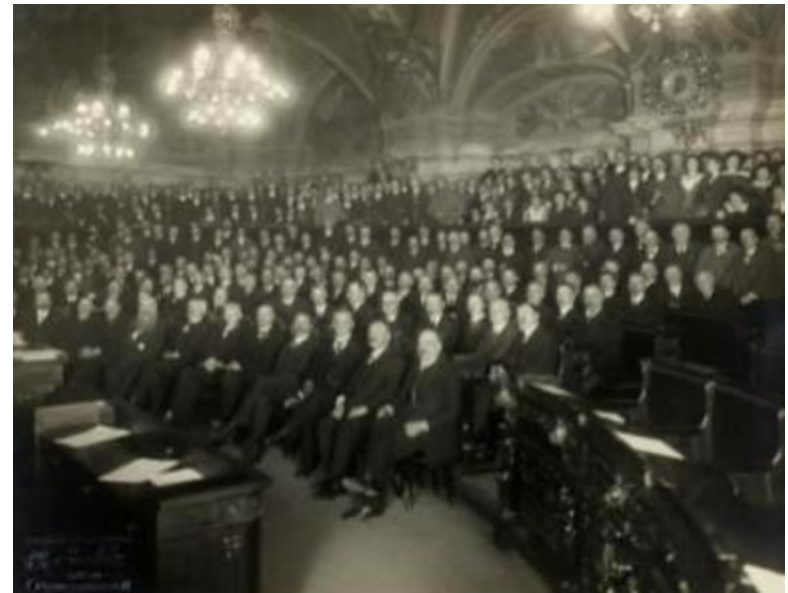
Erste Sitzung der provisorischen Nationalversammlung am 21. Oktober 1918

Im Friedensvertrag von St. Germain en Laye (1919) verpflichtet sich Österreich zur Änderung seines Namens auf „Republik Österreich“.