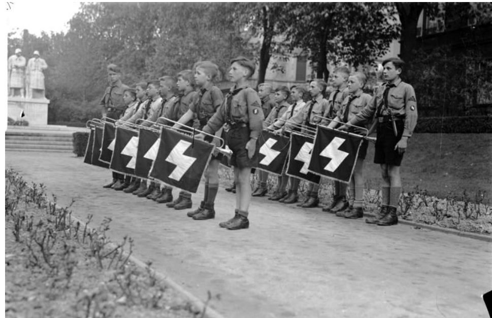
Hitlerjugend, Foto cc Bundesarchiv

Innerhalb der Organisationen: militärische Rangordnung und Gehorsam gegenüber dem „Führer“.