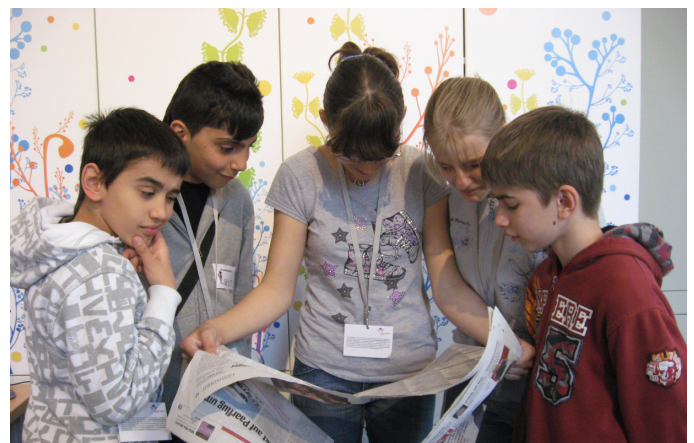
Alle informieren sich aus einer Zeitung!

Medien sind Fernsehen, Radio, Flugblatt, Internet, Zeitung. Sie sind wichtig, damit die ganze Welt weiß, was gerade passiert.