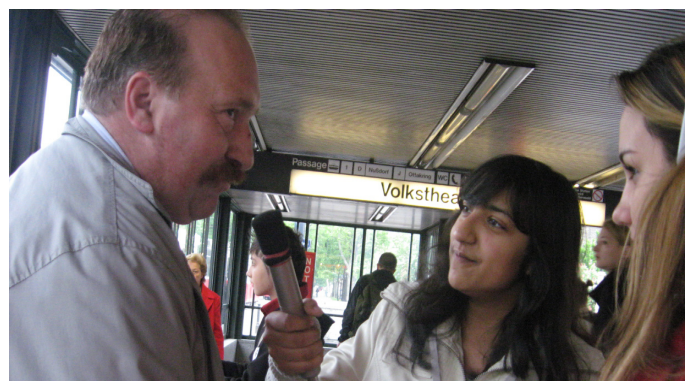
Live bei der Umfrage

Immer wieder trafen wir Menschen, die leider gar keine Meinung hatten und 5 Leute haben uns keine Antwort gegeben.