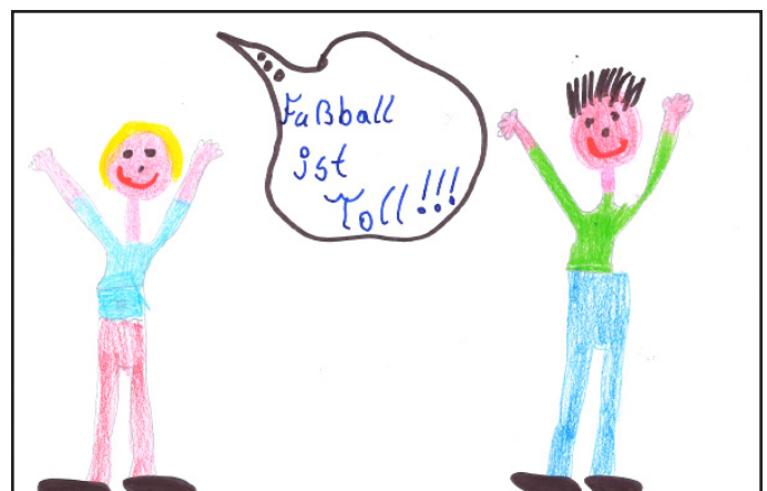
Begeisterte Fußballfans feierten bis in die Nacht

Die Euro-Fanmeile ist das Highlight des Jahres. Sie findet dieses Jahr in Tirol statt. Die Fanmeile liegt zwar 2000 Meter hoch über dem Meeresspiegel, aber es zahlt sich aus. Wenn sie fußballbegeisterte Freunde haben, sollten sie diese einladen - denn ein Tisch kann nur für zehn Personen gebucht werden. Geschäftskunden und Partner sollen vor allem von diesem Angebot profitieren: es wird das gesellschaftliche Ereignis des Jahres.