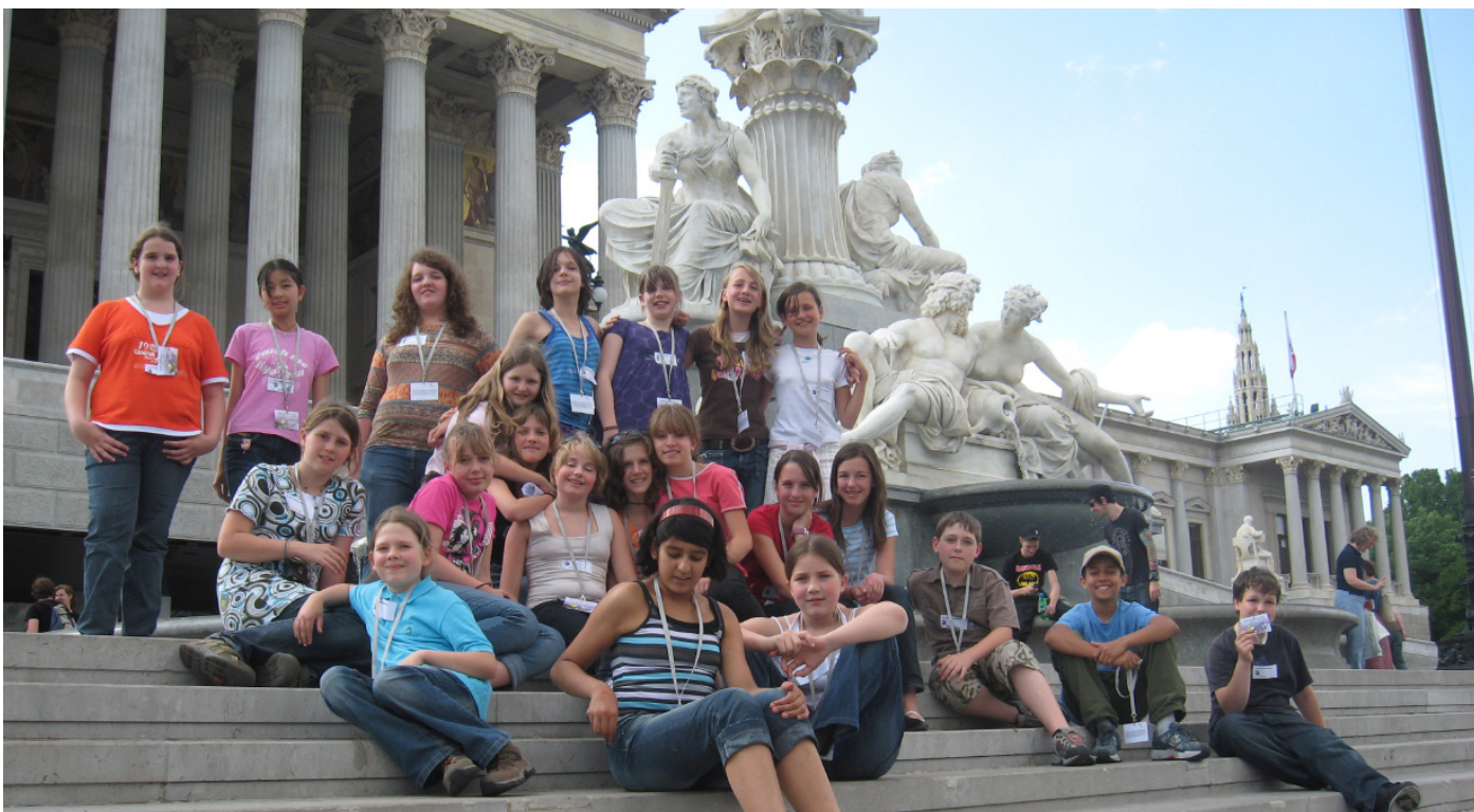
Die fleißigen Journalisten und Journalistinnen der 2a Klasse des BG/BRG Gmunden vor dem Parlament.