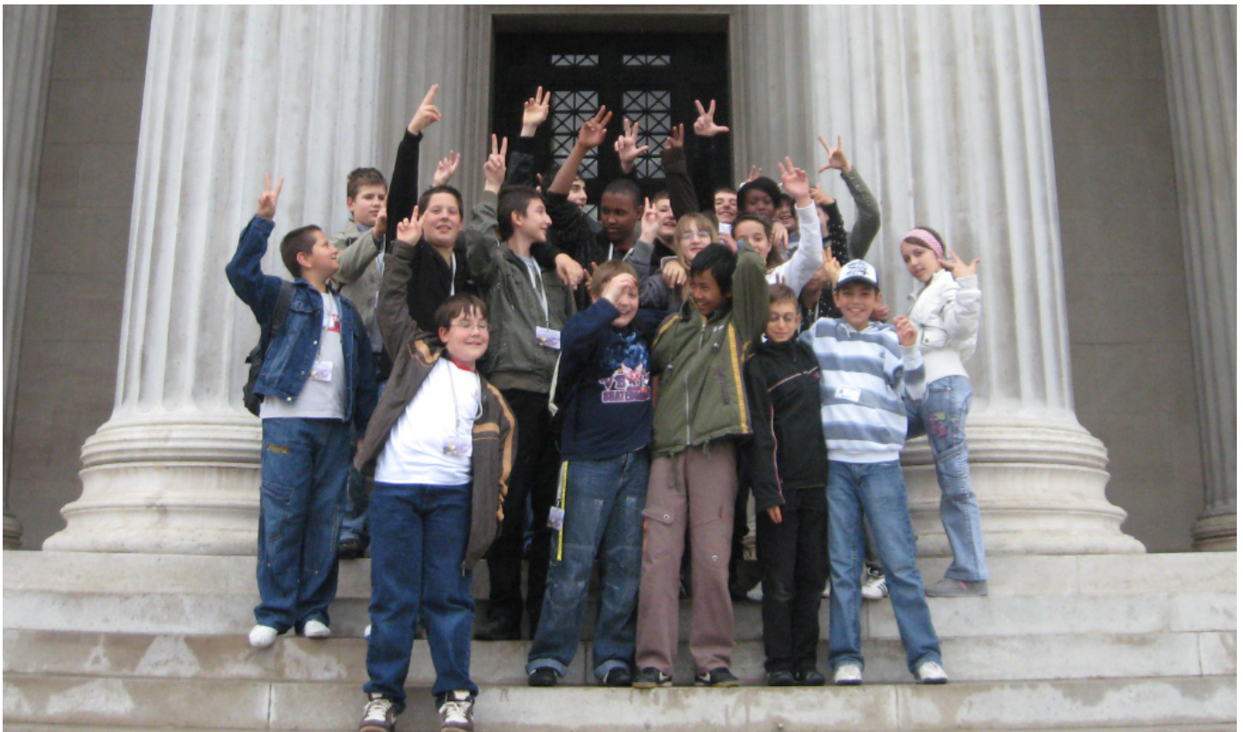
Die 2A der KMS Glasergasse 8, 1090 Wien, jubelt vor dem Parlament.