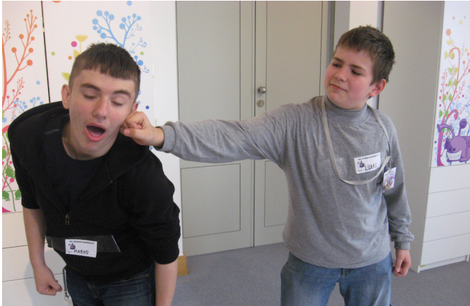
Gewalt kann nicht die Lösung sein!

Wir haben uns heute hier in der Demokratiewerkstatt Gedanken über das Thema „Gewalt in der Schule“ gemacht.