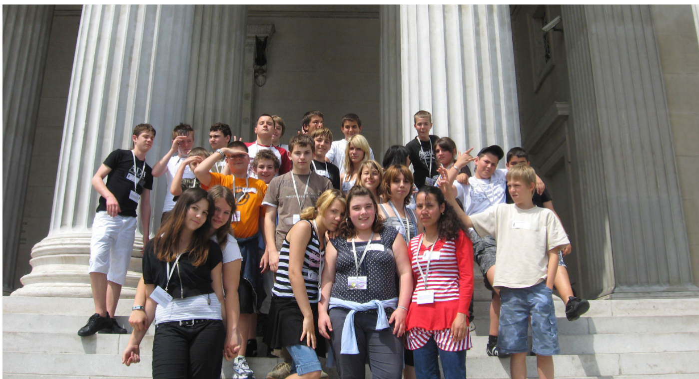
Die Klasse 3C der Jakob Thoma Mittelschule vor dem Parlament