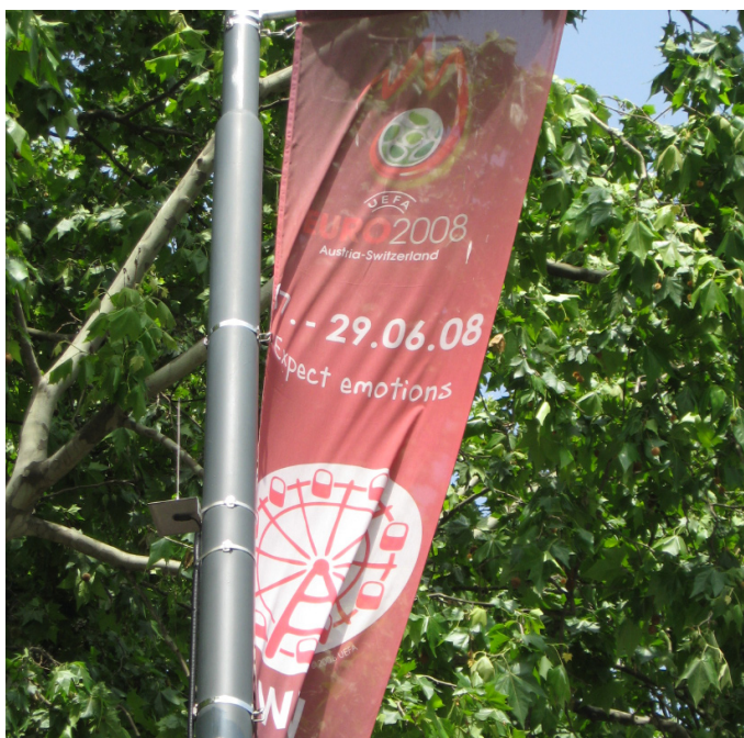
Expect emotions - Alles ist in großer Vorfrende