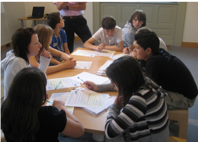
Redaktionssitzung der beiden Umfrage-Teams

In der Demokratiewerkstatt wurden wir in zwei Gruppen eingeteilt, eine pro (positive) und eine contra (negative) Gruppe. Wir erstellten zwei verschiedene Fragebögen. Die Pro-Gruppe fragte die Leute, ob sie sich auf die EM freuen, die andere Gruppe fragte, ob sie diese Großveranstaltung beunruhigt. Wir wollten herausfinden, ob die jeweiligen Gruppen verschiedene Antworten bekommen, je nachdem, wie die Fragen gestellt wurden. Also befragten wir Passanten der Wiener-Ringstraße und des Volksgartens. Anschließend werteten wir die Ergebnisse dieser manipulativen Umfrage aus.