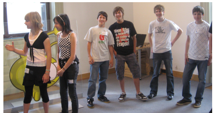
Begrüßung in der Demokratiewerkstatt