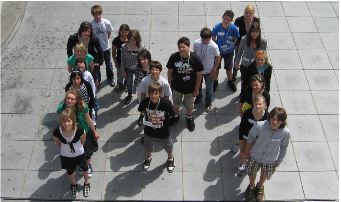
Die Klassen 4a/b/c Hauptschule 2, Spittal/Drau wissen über Manipulation bescheid