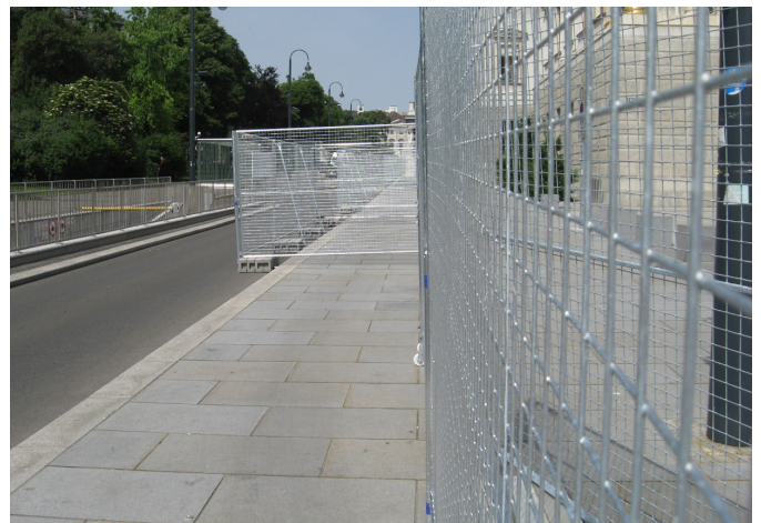
Die zu erwartenden Fanmassen! Sicherheitsrisiko für die die Bewohner von Wien?

Bei diesem Bericht wurden eher die negativen Argumente herausgehoben und die positiven Aspekte wurden mehr zur Seite geschoben. Das alles haben wir gemacht, um euch auf die EM negativ einzustellen. So fanden wir heraus, dass man einen Bericht sehr mit der eigenen Meinung manipulieren kann.