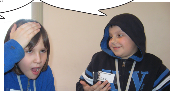
Nachdem sie im Internet nachgeschaut hatten, stellte sich heraus, dass Alex recht hatte.