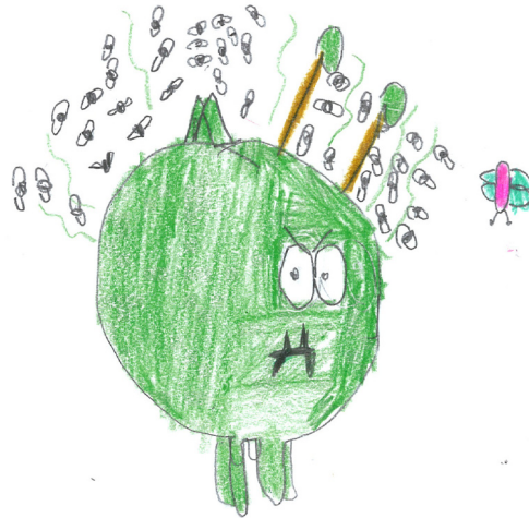
Igitt wie grauslich!

Collecti ist ein äußerst stinkender Geselle. Er hat sich seit Millionen Jahre nicht gewaschen. Er wird sich auch nie in seinem Leben waschen. Seine Haut ist dunkelgrün und er wird von stinkenden Fliegen umschwärmt. Collecti hat stinkende Vampirzähne, die aus seinem öligen Maul herausschauen.