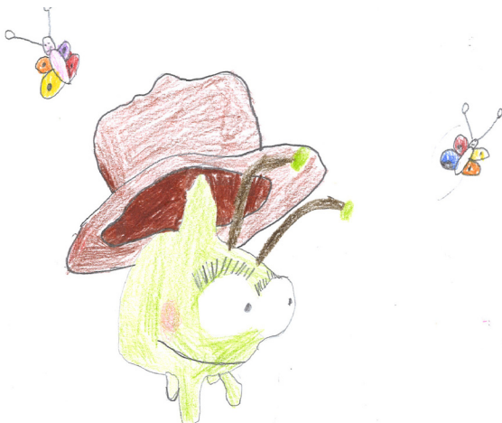
Oh wie süß!