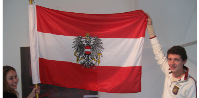
Wie unsere Fahne aussieht steht auch in der Verfassung..

Doch welche der vielen Inhalte der österreichischen Verfassung sind für Menschen wie dich und mich eigentlich wichtig?