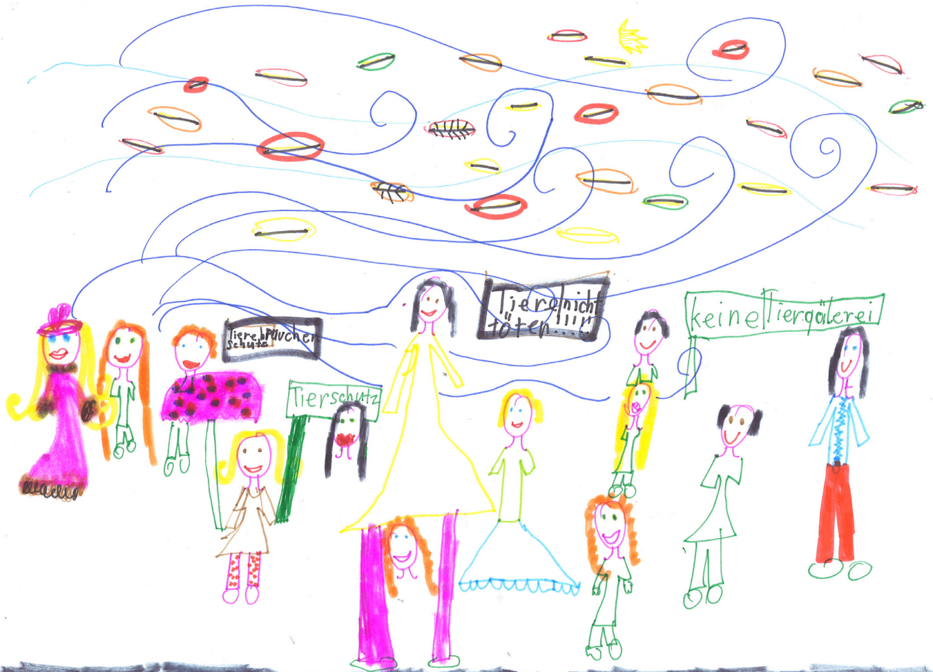
Eine andere Demonstration, gezeichnet von Michelle.