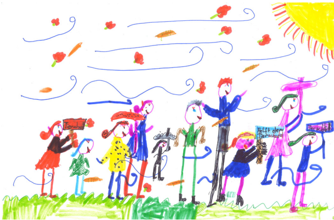
Eine Demonstration, gezeichnet von Steffi.