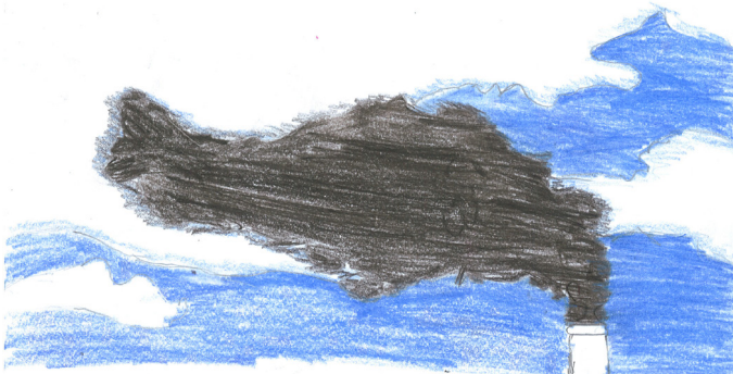
Abgase aus einem Fabriksschornstein, gezeichnet von Junnel (10).

Schmutz und Gifte verbreiten sich über die ganze Welt. Schuld sind Fabriken, Abgase von Autos, zu viele Atomkraftwerke, Wärmekraftwerke, usw. Es reicht schon eine Fabrik, die giftige Abgase ausstößt. Wind und Wetter sorgen dafür, dass sie sich über die ganze Welt verbreitet. Die EU hat Regeln dafür, wieviel Abgase höchstens ausgestoßen werden dürfen.