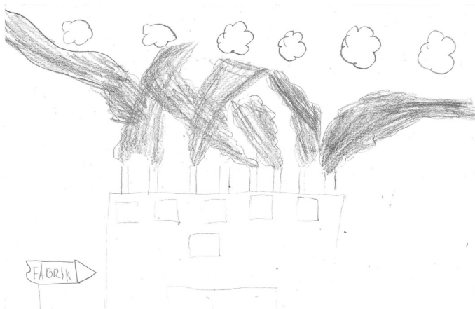
Fabrik, gezeichnet von Zaklina (12).

Zum Beispiel durch Recycling. In Österreich haben wir verschiedene Mülltonnen. Wir trennen Plastik, Glas, Papier, Kompost, Metall. Diese Sachen kann man nämlich wiederverwenden und der Restmüllberg wird nicht mehr ganz so groß.