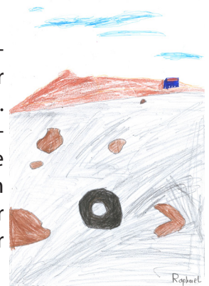
Gezeichnet von Raphael (11).

Wir können aber auch noch andere Dinge tun, um die Umwelt zu schützen: man kann statt mit dem Auto zu fahren zu Fuß gehen oder mit dem Rad fahren. Wenn man einen Raum verläßt, soll man immer das Licht ausschalten. Es ist besser, den PC oder den Fernseher immer ganz auszuschalten.