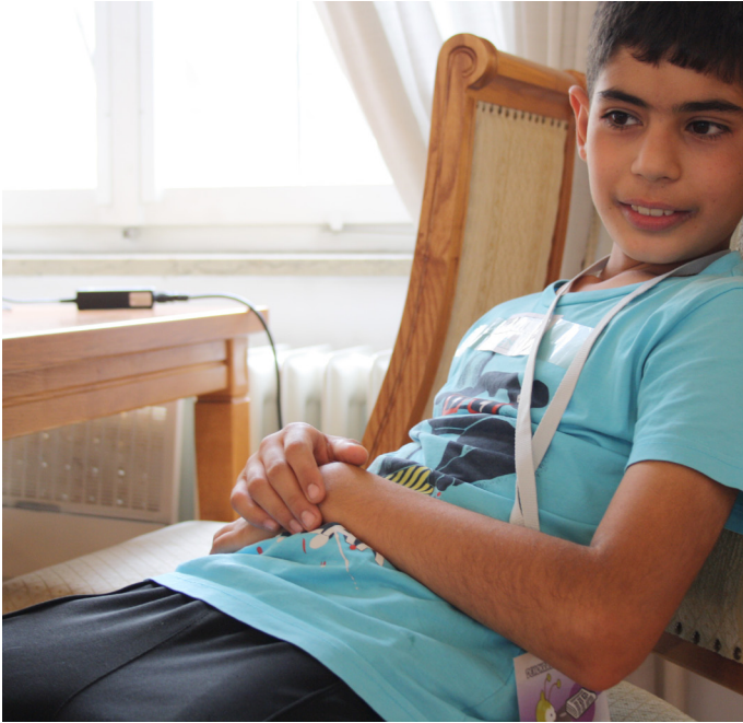
Ist Cem faul?