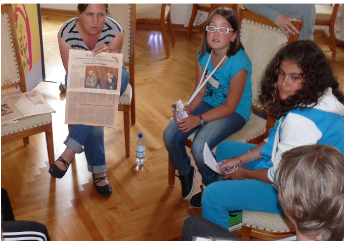
Das Team während des Interviews.