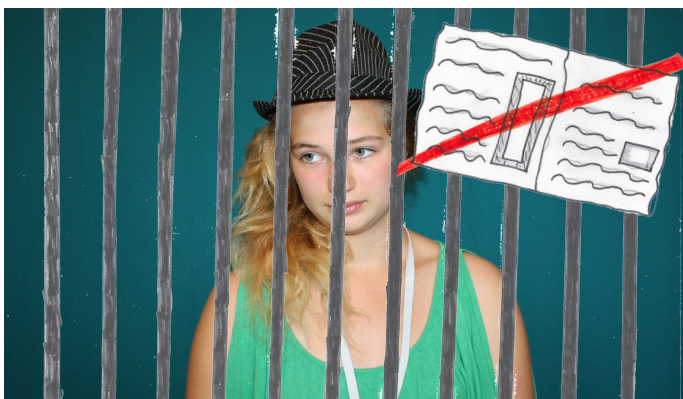
Weil die Reporterin kritisch war, kommt sie ins Gefängnis. Der Artikel wird nicht veröffentlicht.