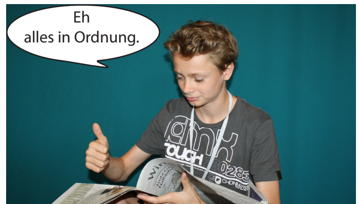
Der Leser findet nichts in den Medien gegen den Diktator.