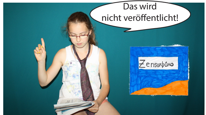
Bevor der Artikel veröffentlicht werden kann, muss er vom Zensurbüro genehmigt werden.