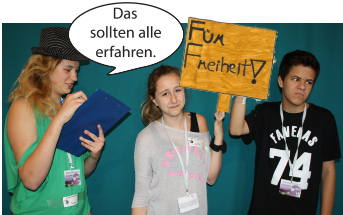
Menschen in einer Diktatur protestieren für mehr Freiheit und gegen den Diktator. Eine Reporterin ist vor Ort.