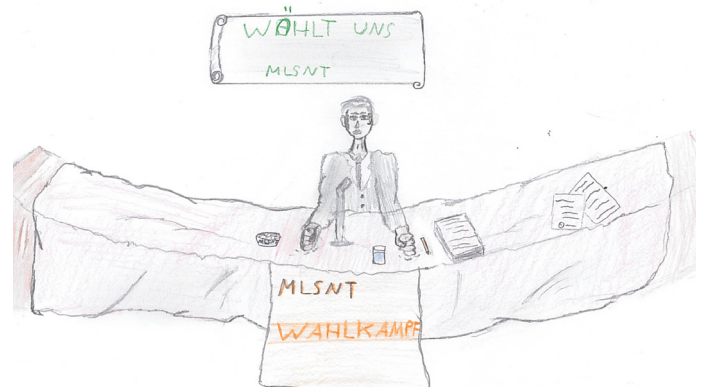
Ein Parteimitglied wirbt.

Wir finden es in Ordnung, dass Wahlgeschenke ausgeteilt werden, aber es ist lästig, wenn sie einem aufgedrängt werden. Wir denken, es ist sinnvoll, dass man vor der Wahl viel in den Medien über die Parteien erfährt, um sich besser informieren zu können. Dann ist es leichter, sich eine Meinung zu bilden und eine Partei zu wählen.