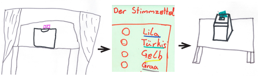
Und so funktioniert eine Wahl: In der Wahlkabine füllt man den Stimmzettel aus, den gibt man danach in die Wahlurne - ganz einfach.