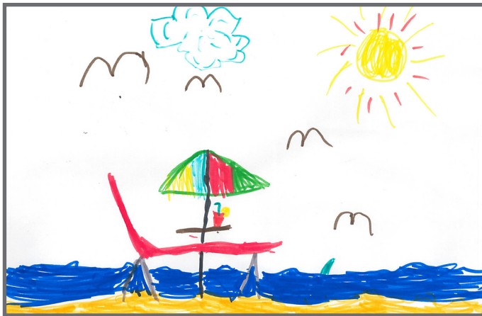
Ich darf mitbestimmen, wohin wir auf Urlaub fahren.

Heute geht es um Mitbestimmung. In einer Demokratie darf man mitbestimmen, zum Beispiel bei Wahlen. Dafür muss man aber mindestens 16 Jahre alt sein. Wir Kinder können aber auch schon einiges mitbestimmen.