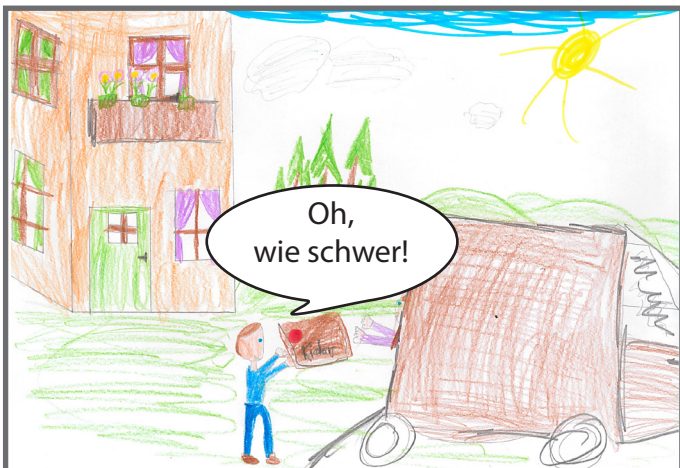
Wenn wir umziehen, darf ich mitbestimmen, wohin.