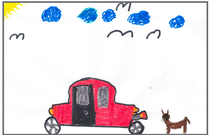
Ich darf mitbestimmen, welchen Hund ich haben möchte. Auch bei unserem neuen Auto durfte ich mitreden.