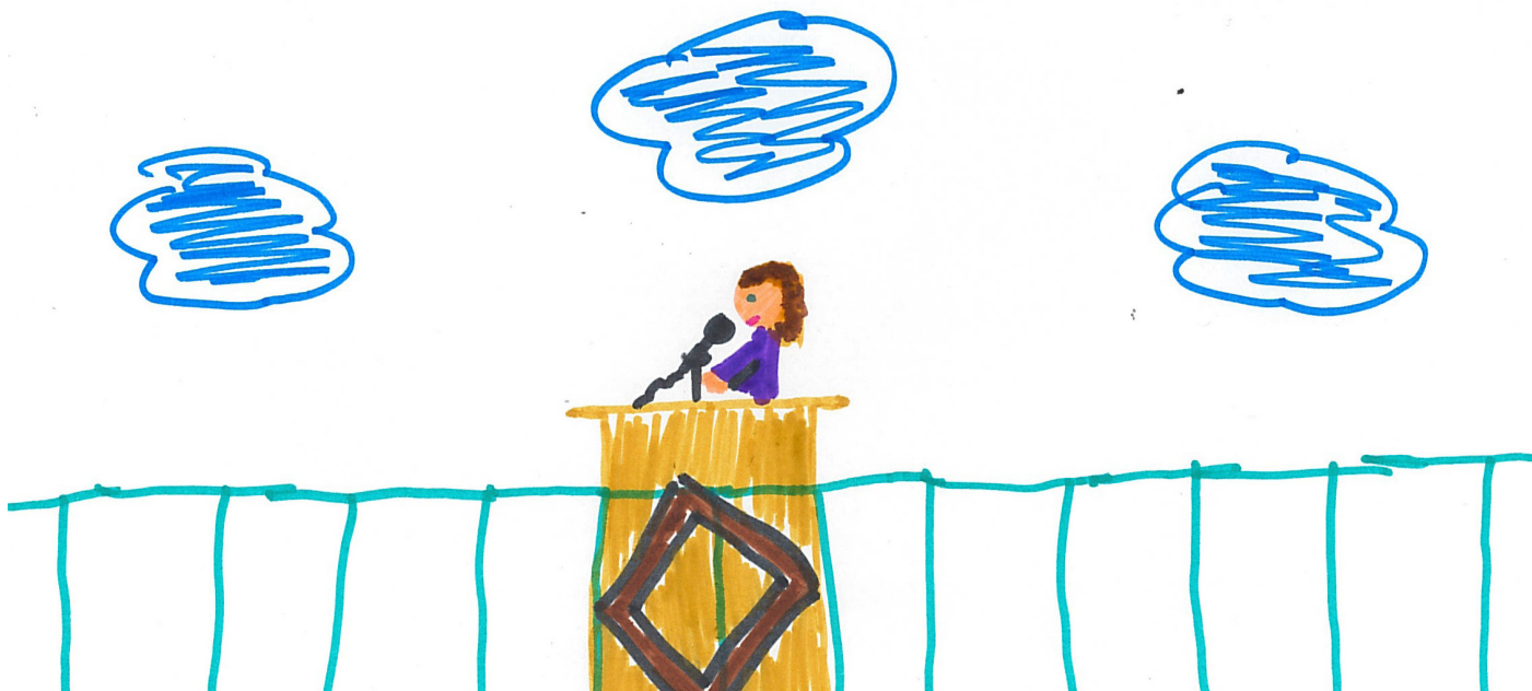
Eine Bürgermeisterin hält ihre Rede.