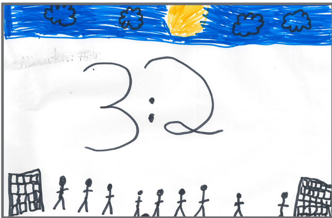
Ich darf mitbestimmen, was wir in der Schule spielen.