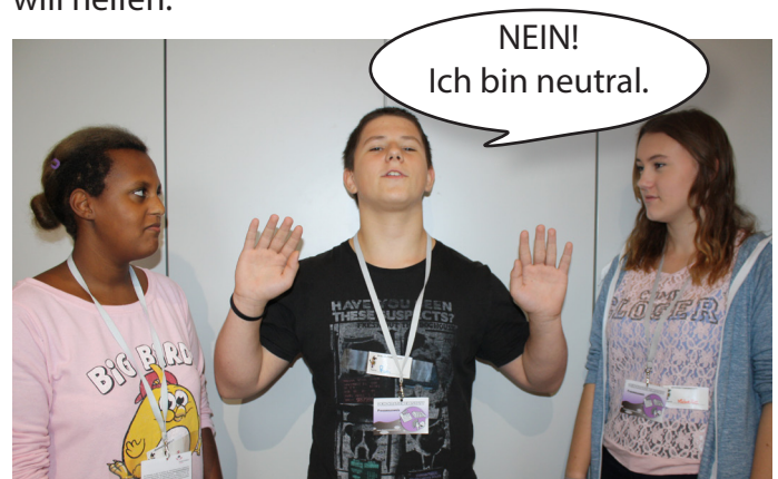
Doch der Freund bleibt neutral und hilft zu keiner der beiden Freundinnen.