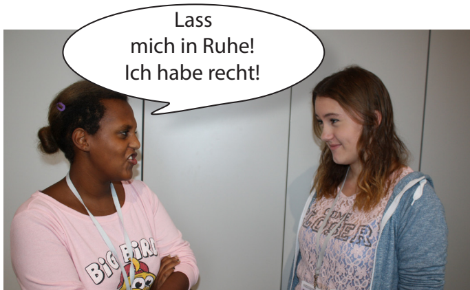
Zwei Freundinnen streiten sich.

anschließen konnte. Deswegen bekam Österreich den Staatsvertrag und die Alliierten verließen das Land. Am 26.10.1955 wurde die Neutralität in die Verfassung geschrieben. Dieses Verfassungsgesetz gilt bis heute und deswegen leben wir in einem neutralen Staat. Wir finden das gut, weil wir keinen Krieg miterleben müssen. In unserer Bildgeschichte erklären wir euch, was es heißt, neutral zu sein.