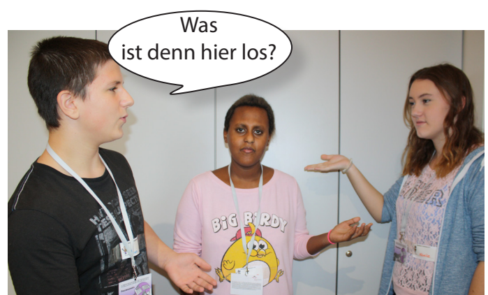
Ein Freund der beiden weiß nicht, was los ist und will helfen.