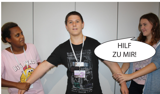
Die zwei Freundinnen streiten sich und wollen, dass der Freund ihnen hilft.