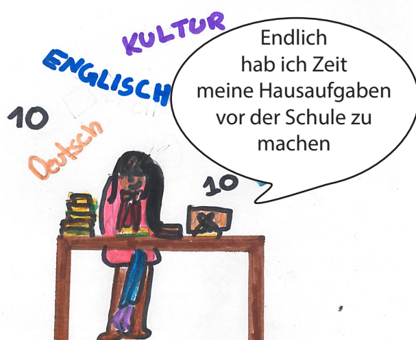
Eine Schülerin hat aber Zeit, ihre Hausübung am Morgen zu machen.