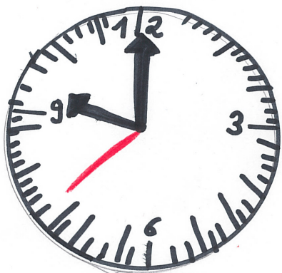
Wie wäre es, wenn die Schule um 10 Uhr beginnen würde?