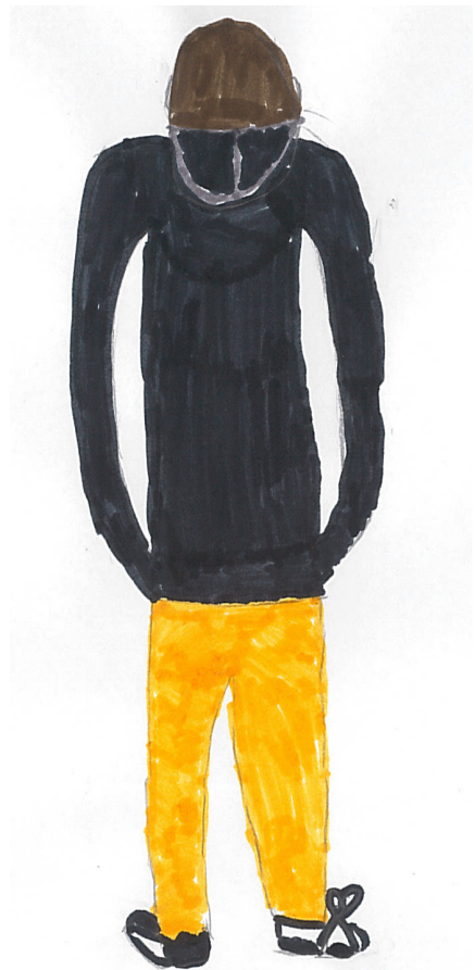
Diese Person hat kein Interesse an Politik.