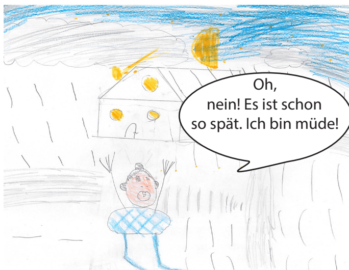
Die Schule beginnt später. Ein Schüler kommt deswegen sehr spät nach Hause..

Wir haben uns überlegt, wie es wäre, wenn die Schulzeiten anders wären. Es gab positive und negative Kommentare. Das Positive wäre, dass die Schule dann um zehn Uhr anfangen würde und man länger schlafen kann. Ein zweiter positiver Punkt wäre, dass man in der Früh mehr Zeit hätte, um Sachen für die Schule zu erledigen. Negativ wäre, dass man weniger Zeit für Aktivitäten am Nachmittag hätte. Ein weiterer Nachteil wäre auch, dass man später nach Hause kommt. Mittagessen müsste dann natürlich in der Schule angeboten werden. Wichtig ist: Die Schule betrifft uns alle! Deswegen sollten wir mitbestimmen können! Bevor man mitbestimmt, muss man sich eine Meinung bilden. Das heißt, man muss viel über ein Thema nachdenken. Wie ihr oben seht, hat jedes Thema positive und negative Seiten. Deswegen muss man sich überlegen, was man will und was einem wichtig ist.