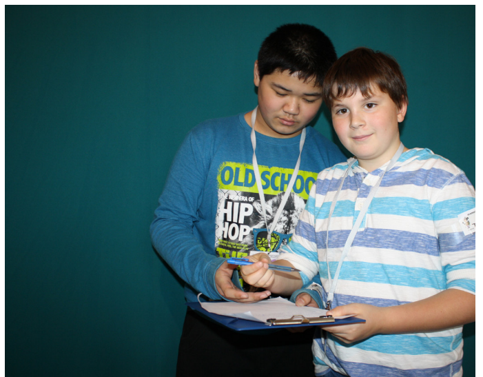
Er überzeugt andere von seiner Idee...