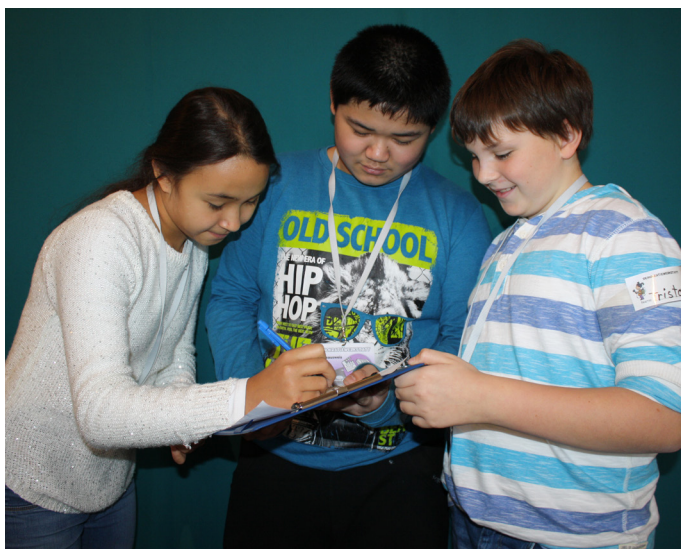
... und sammelt viele Unterschriften.