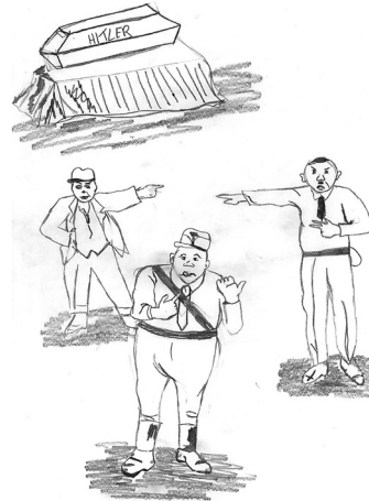
Karikatur aus der Nachkriegszeit

Damals gab es fast 700.000 ehemalige österreichische NSDAP-Mitglieder, davon wurden nach 1945 rund 540.000 registriert. Und je nachdem wie sie strafrechtlich eingestuft wurden, gab es unterschiedliche Sühnemaßnahmen. Registrierte ehemalige NSDAP-Mitglieder wurden zunächst von Positionen und bestimmten Berufen, wie z.B. LehrerInnen, ausgeschlossen. Sie durften auch nicht