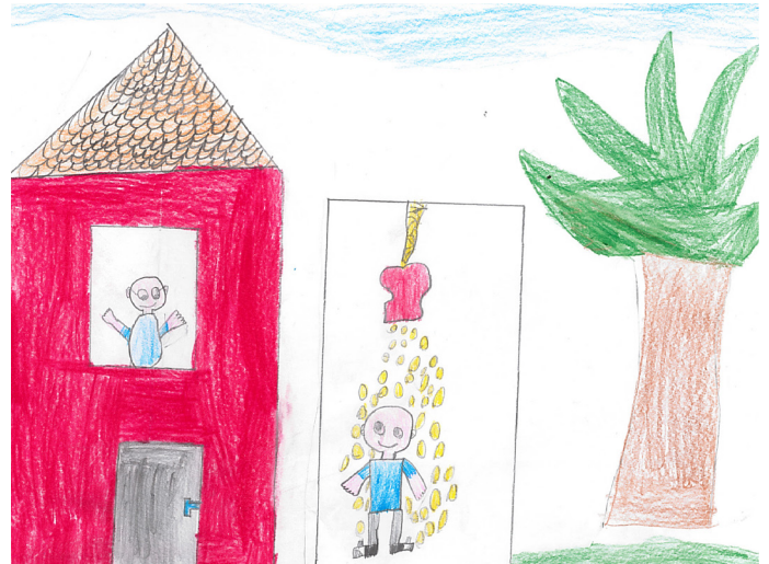
Der „Goldregen“ für den fleißigen Sohn.

Wir haben heute das Märchen „Frau Holle“ für euch umgeschrieben. Dabei wird euch auffallen, dass wir in unserem Märchen alle Frauen zu Männern, und umgekehrt verwandelt haben. Einfach, weil wir die Geschichte einmal mit Männern in den Hauptrollen erzählen wollten.