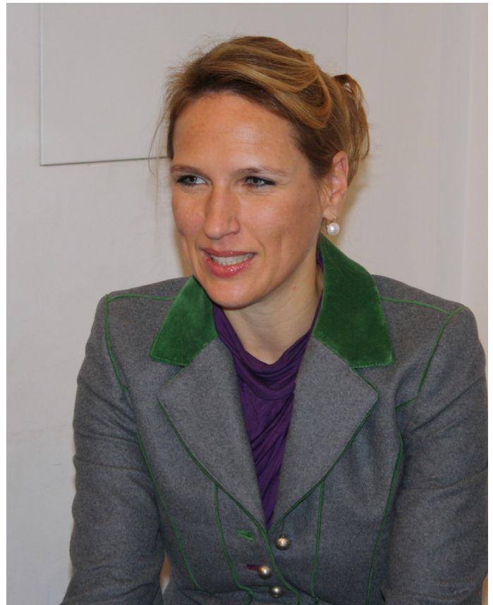
Dr. Kathrin Nachbaur