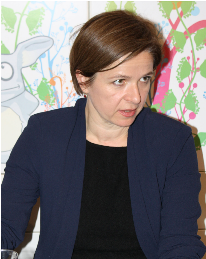
Mag. Judith Schwentner

Dr. Kathrin Nachbaur (36 Jahre) von der ÖVP und Mag. Judith Schwentner (47 Jahre) von den Grünen.