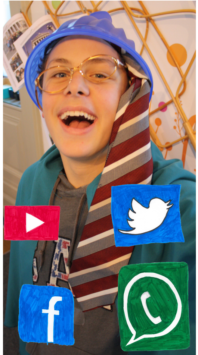
Viele Menschen denken nicht gut nach, bevor sie etwas posten.

Zum Schluss haben wir uns noch gedacht, dass man immer Informationen vergleichen und nicht gleich auf alles vertrauen sollte, was man liest, hört oder sieht. Wenn ihr euch wo nicht sicher seid, fragt eine Person, der ihr vertraut.