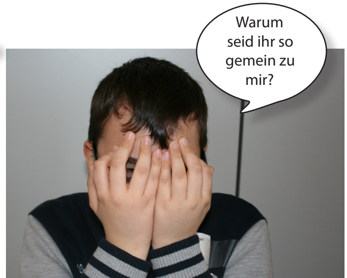
Der Mitschüler ist sehr traurig.