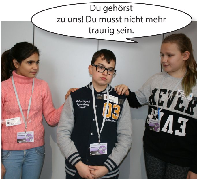
So verhält man sich richtig: Andere kommen und helfen dem Buben. Dadurch fühlt er sich besser und freundet sich mit ihnen an.