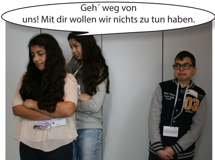
Ein Schüler wird von seinen MitschülerInnen diskriminiert.

den Haushalt und die Kinder kümmern. Wenn man diskriminiert wird, fühlt man sich ausgeschlossen, und das macht Menschen unglücklich. Wir finden, dass Diskriminierung unmenschlich ist. Man sollte Leuten helfen, die davon betroffen sind. Wenn dir oder jemand anderem so etwas passiert, dann wende dich an eine Vertrauensperson (zum Beispiel einen Psychologen/eine Psychologin) oder einen Erwachsenen. Damit ihr es euch besser vorstellen könnt, haben wir auch eine Fotostory zum Thema gemacht.