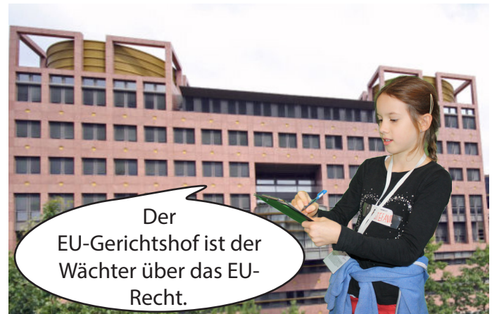
Der Europäische Gerichtshof ist in Luxemburg.