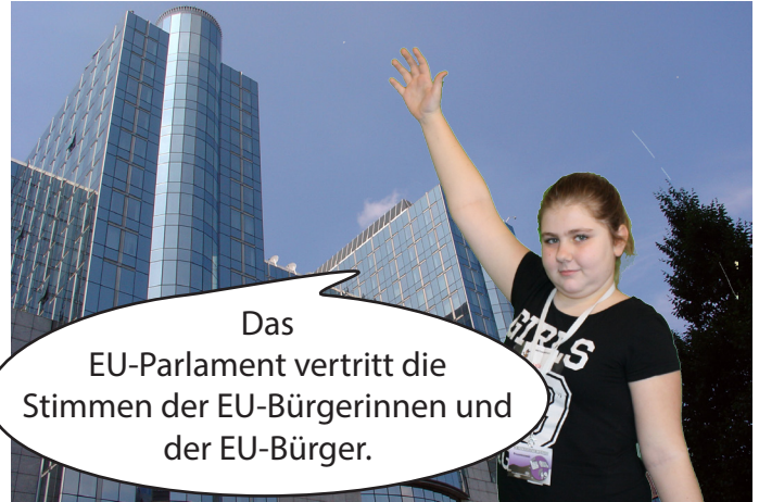
Das EU-Parlament hat Gebäude in Brüssel und in Straßburg.