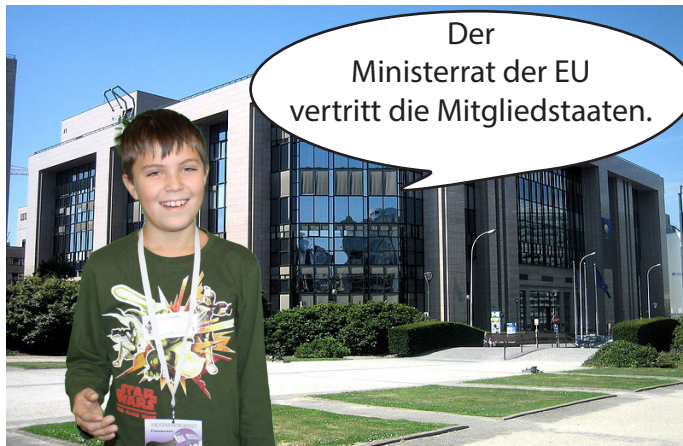
Im Ministerrat der EU treffen sich die jeweiligen Minister und Ministerinnen.