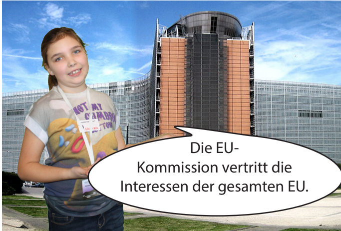
Jeder der 28 EU-Mitgliedstaaten bestimmt eine/n Kommissar/in in der EU-Kommission.

Wir haben uns mit den verschiedenen Institutionen der EU beschäftigt. Jede/r von uns hat sich eine davon ausgesucht und stellt sie euch vor. Wir haben uns auch angeschaut, wie Gesetze in der EU entstehen.