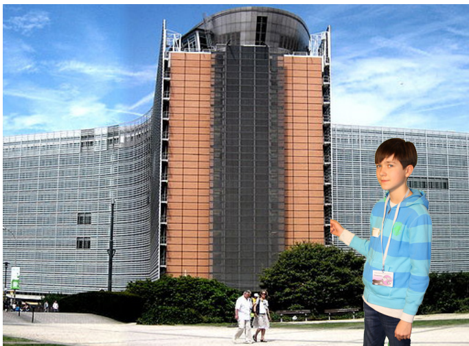
Roman vor der EU-Kommission.