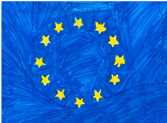
Seit 1992 heißt die Gemeinschaft „EU“.

EU: Die ersten Länder waren Deutschland, Belgien,