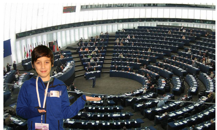
Melih im EU-Parlament.

Einmal im Monat versammelt sich das EU-Parlament in diesem Gebäude in Straßburg (Frankreich). Die meiste Zeit über arbeiten die Abgeordneten aber in Brüssel. Das EU-Parlament hat 751 Mitglieder.