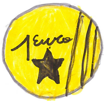
Den Euro gibt es seit 2002 als Zahlungsmittel.

EU: In diesem Jahr wurden die Zölle zwischen den