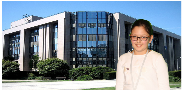
Emili vor dem Ministerrat der EU.

Wenn es z.B. um ein Finanzgesetz geht, schickt jedes Mitgliedsland seinen Finanzminister/ seine Finanzministerin zu dem Treffen der FinanzministerInnen. Im Ministerrat stimmen die MinisterInnen aus allen EU-Ländern über einen neuen Vorschlag der Kommission ab.