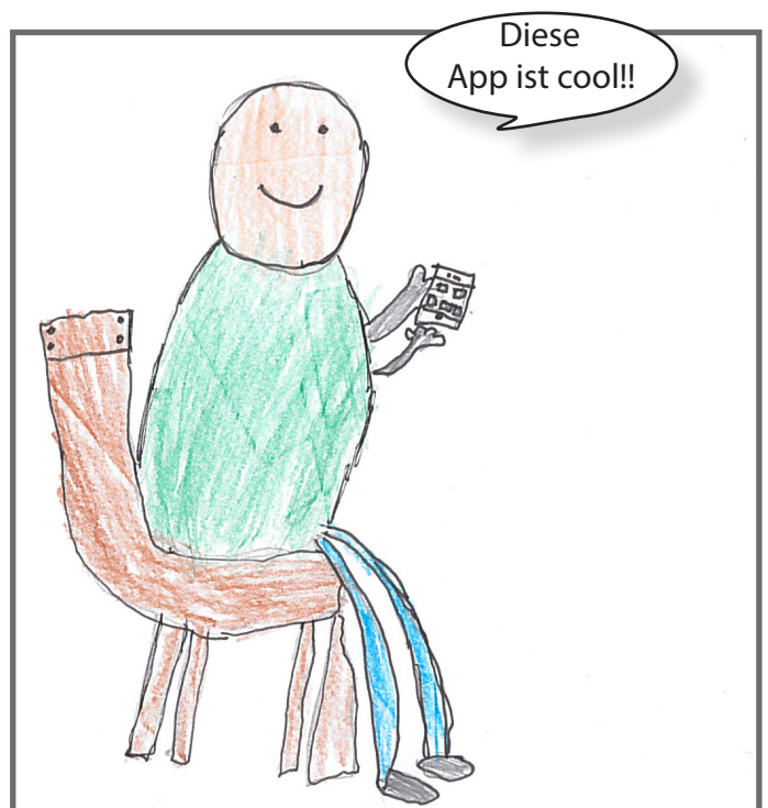
Das Kind lernt in der Schule Vokabel auf dem Handy.