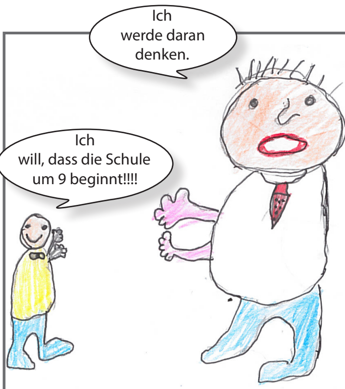
Das Kind redet mit dem Politiker.

Die PolitikerInnen entscheiden, wofür die Steuern ausgegeben werden. Die Menschen in Österreich haben die PolitikerInnen gewählt. Deswegen dürfen diese PolitikerInnen entscheiden. Wir finden, dass die PolitikerInnen auf die Kinder hören sollen.