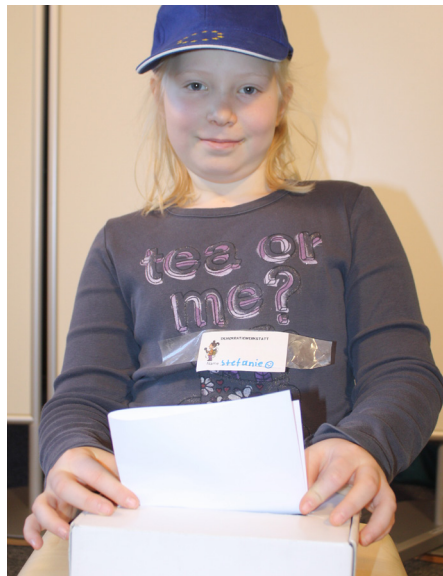
Ich gebe meine Stimme bei der Wahl ab und wähle meine VertreterInnen.