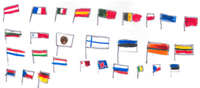
Das sind die Fahnen der Mitgliedsländer.

Ein Gesetz kann jedoch nur entstehen, wenn mehr als die Hälfte der Abgeordneten im EU-Parlament zustimmen. Auch der Rat der EU muss über die Gesetze abstimmen. Die Gesetze gelten dann auch für uns und für die anderen Menschen in der EU.