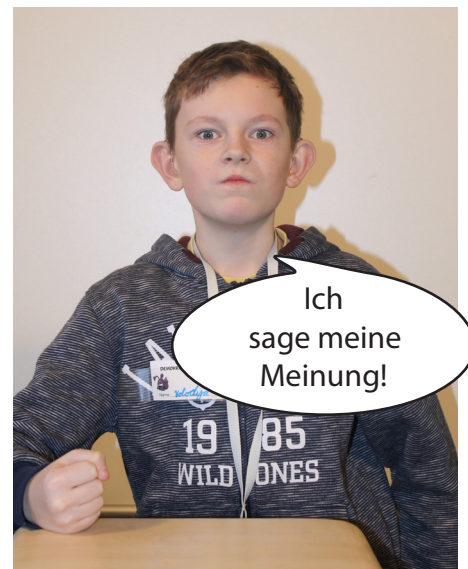
Alle dürfen mitbestimmen!