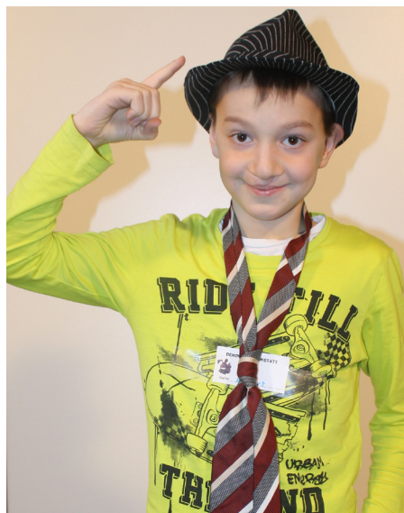
Ich bin euer EU-Abgeordneter ROBERT.

Man muss seine Meinung sagen, sonst kann man nicht mitbestimmen. Jede/r kann seine/ihre Meinung sagen, auch wenn er/sie noch nicht 16 Jahre alt ist. Man