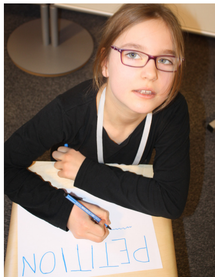
Ich schreibe einen Brief an den EU-Abgeordneten ROBERT.