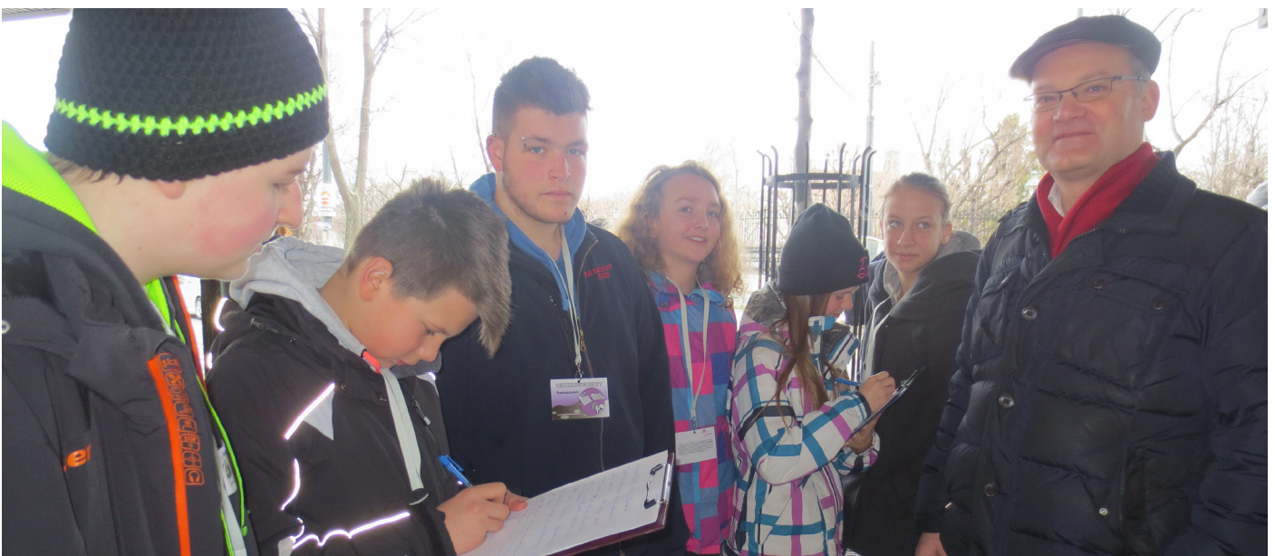
... und bei der Umfrage auf der Straße.

die Demokratie tun?“ sehr ausführlich beantwortet. Wir haben die wichtigsten Aussagen zusammengefasst: Mitreden, Meinung sagen, wählen gehen, diskutieren, Argumente sammeln und protestieren. Auf der Straße kamen folgende Antworten am häufigsten: wählen, demonstrieren, Meinungen zulassen und an Volksabstimmungen teilnehmen.