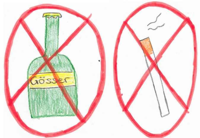
Jugendschutzgesetz: Verbot des Konsums von Alkohol & Zigaretten.

Menschen ins Parlament bekommen, um ihnen mehr Mitsprache zu ermöglichen. Außerdem gibt es die Möglichkeit, sie bei Anliegen zu kontaktieren.