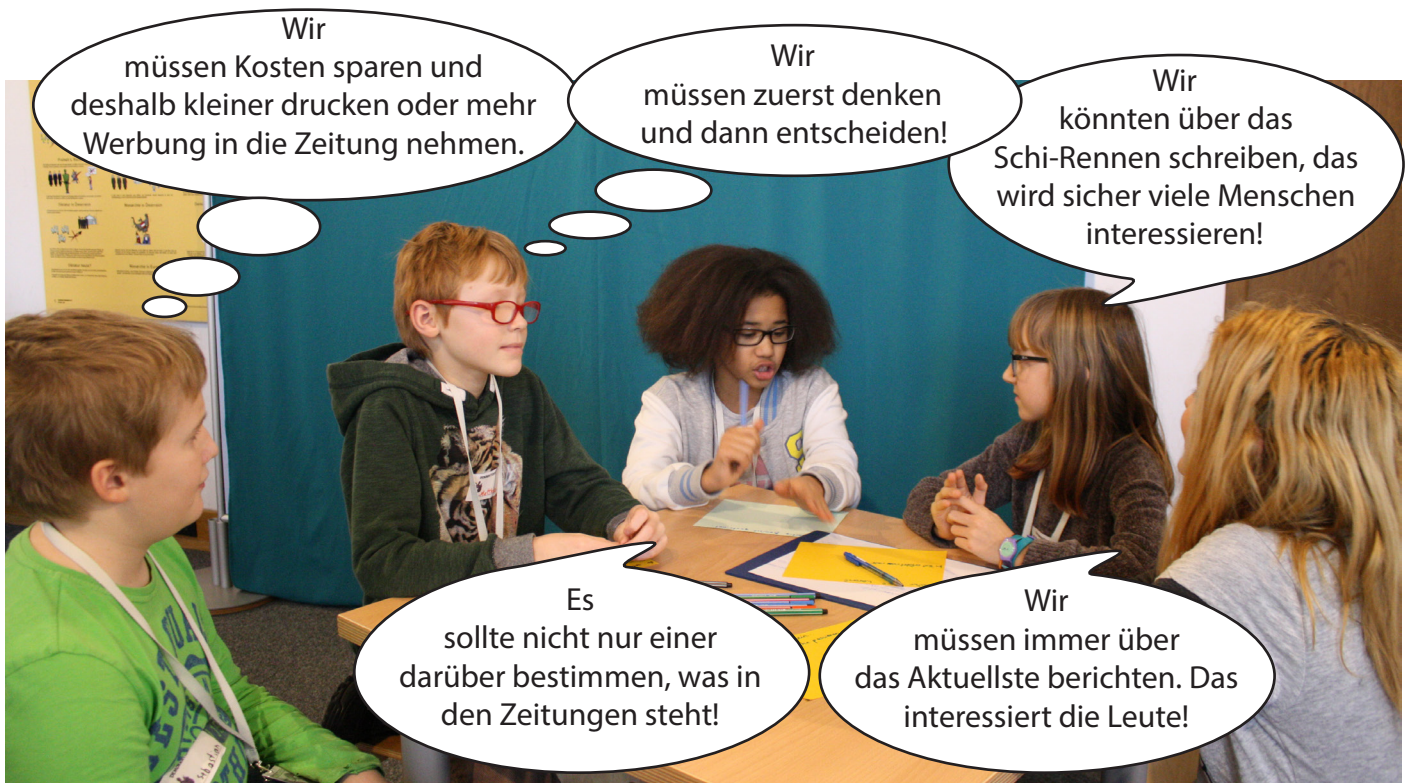
ReporterInnen diskutieren, welche Themen in ihre Zeitung kommen sollen.