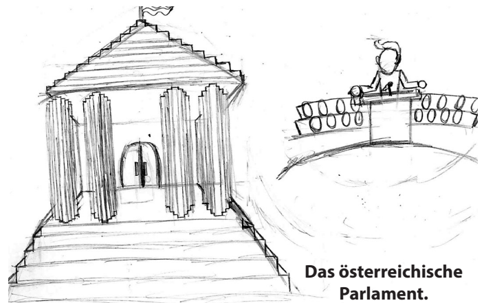
Das österreichische Parlament.

Die nächste Nationalratswahl ist spätestens im Oktober 2018.