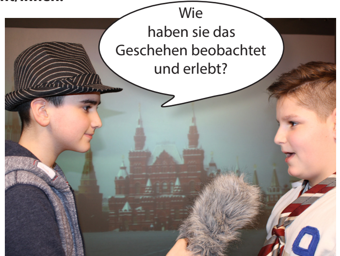
Live Passanten-Befragung in Moskau.

Wir schalten nun live zu unserem Korrespondenten in Moskau.