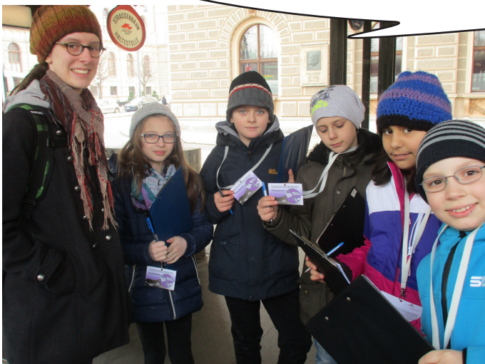
Das ReporterInnen-Team bei der Umfrage.

Wir haben heraus gefunden, dass die Leute, die wir gefragt haben, mit verschiedenen Worten die gleiche Meinung vertreten haben. Allen ist Themen-, Medien- und Meinungsvielfalt wichtig.