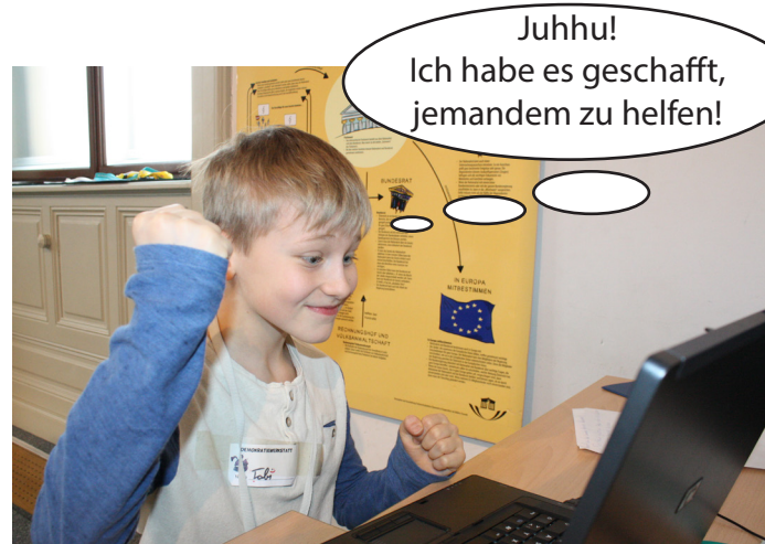
Tobi hat es geschafft, einem User zu helfen, seine Ansichten über Hunde zu hinterfragen.