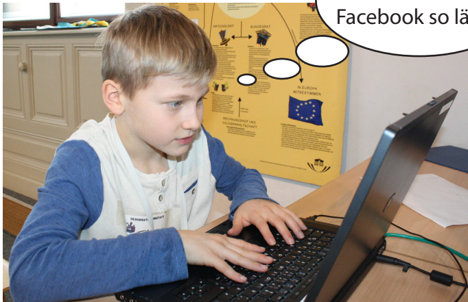
Tobi sitzt vor dem Computer und ist auf Facebook. Da entdeckt er ein Vorurteil.

Wir haben uns eine Fotostory über Vorurteile überlegt. Viel Spaß beim Lesen!