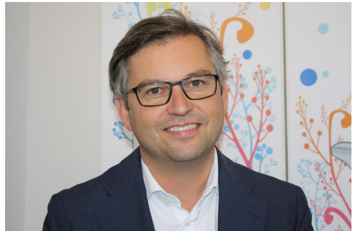
Dr. Magnus Brunner

Er wurde in Kufstein am 15. Oktober 1951 geboren. Er ist Mitglied in verschiedenen Ausschüssen des Nationalrats. Er arbeitet schon zehn Jahre im Parlament.