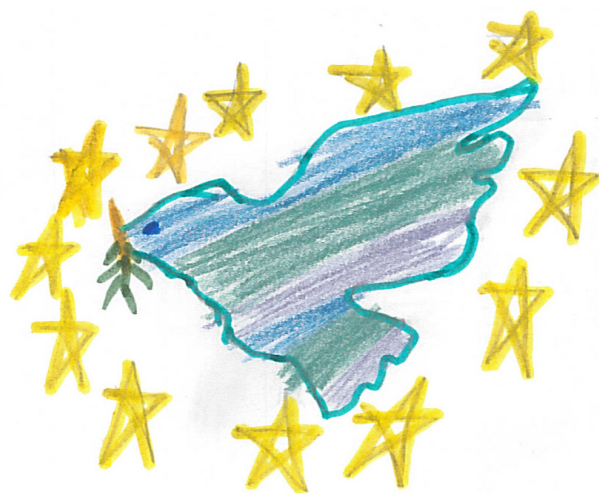
Die Friedenstaube ist ein Symbol für Frieden - die Grundidee der Europäischen Union