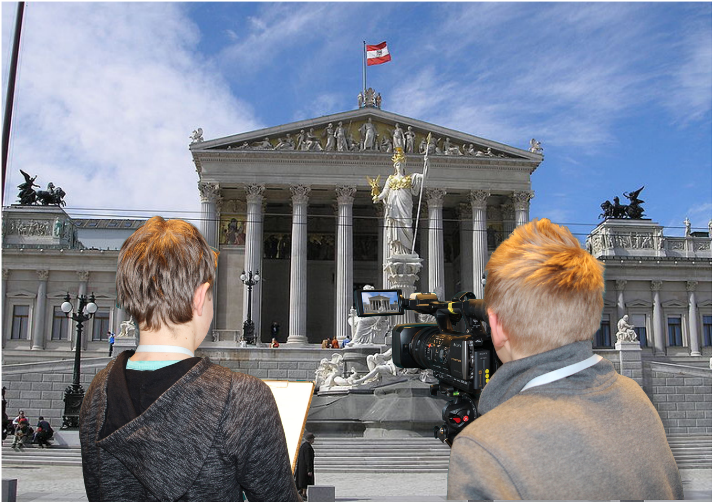
Reporter bei ihrer Arbeit: sie berichten über das Parlament. Niemand darf sie daran hindern.