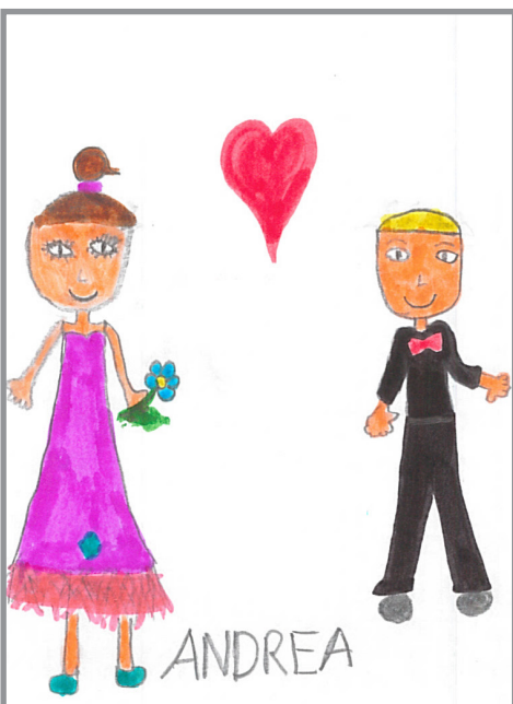
Recht auf elterliche Fürsorge