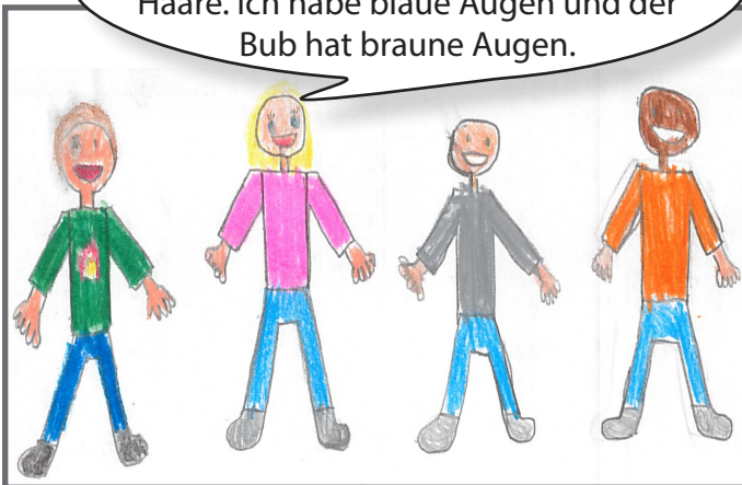
Menschen haben vielfältiges Aussehen.

Ich habe Locken und der Bub hat glatte Haare. Ich habe blaue Augen und der Bub hat braune Augen.