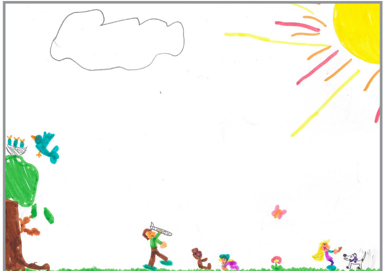
Recht auf Spiel und Freizeit