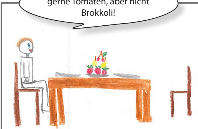
Menschen haben verschiedene Vorlieben.

Ich esse gerne Tomaten, aber nicht Brokkoli!