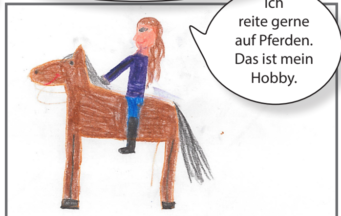
Es gibt eine Vielfalt an Hobbys.

Ich reite gerne auf Pferden. Das ist mein Hobby.