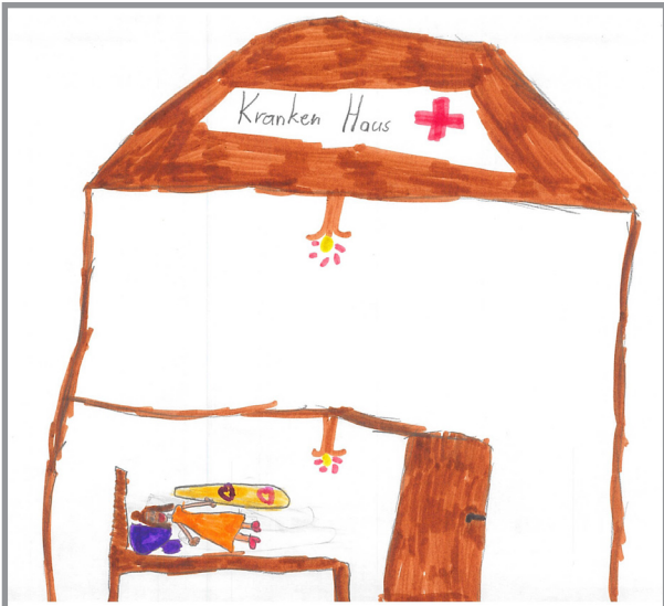
Recht auf Gesundheit

Es ist wichtig, dass es keine Diskriminierung oder Gewalt gibt. Es soll auch Glaubens-, Gewissens- und Meinungsfreiheit für alle geben, damit alle gleich behandelt werden.