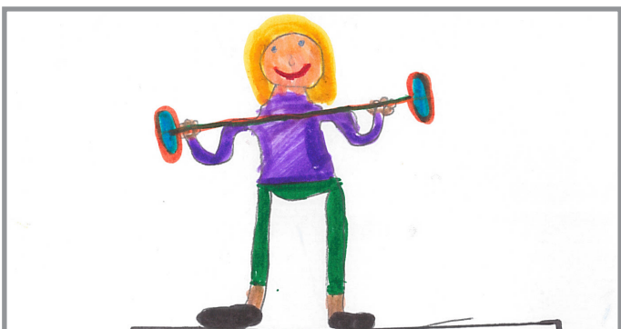
Auch Mädchen sind stark!