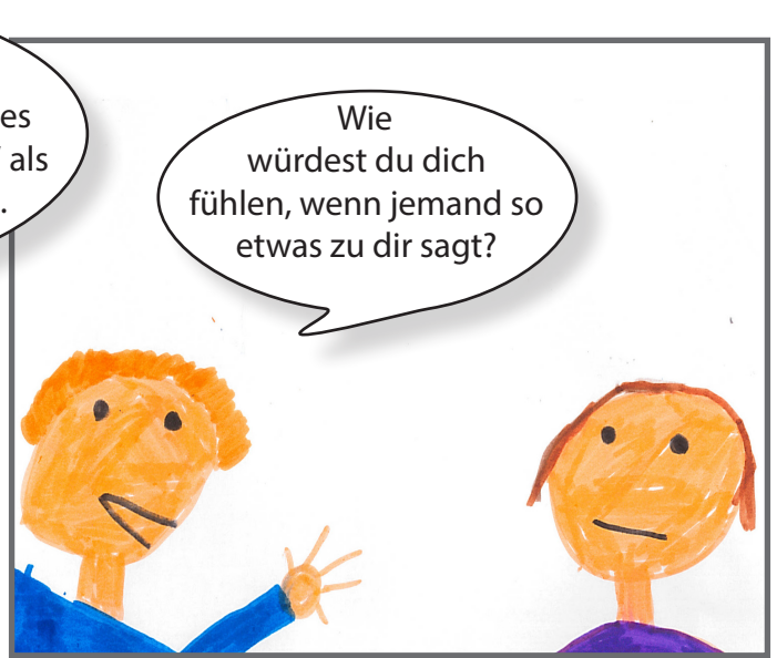
Er erklärt dem Buben, dass das nicht in Ordnung ist, was er gemacht hat.