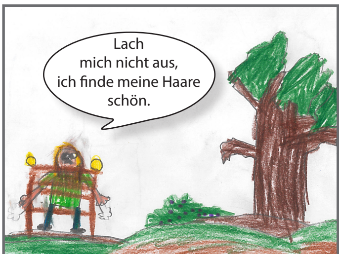
Daniel antwortet ihm, dass er ihn in Ruhe lassen soll.