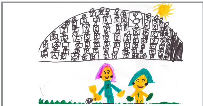
Die Mädchen haben einen Preis beim Fußball gewonnen.

Und trotzdem gibt es viele Vorurteile z.B. über Männer und Frauen, die uns einschränken, weil sie uns vorgeben, wie wir sein sollen. Mehr darüber findet ihr in unserem Artikel!