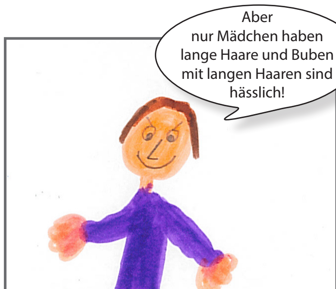
Aber der Bub gibt keine Ruhe.