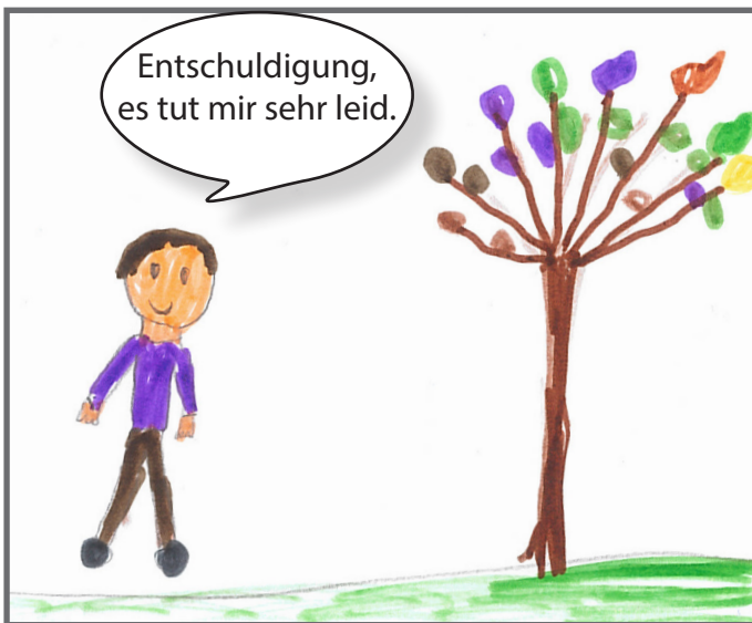
Der Bub versteht, dass er etwas falsch gemacht hat.