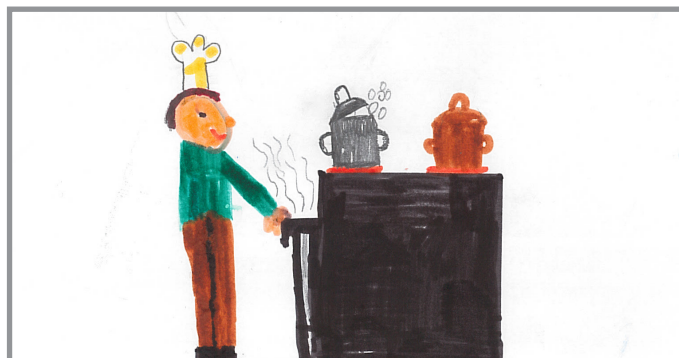
Dieser Bub kocht gerne.