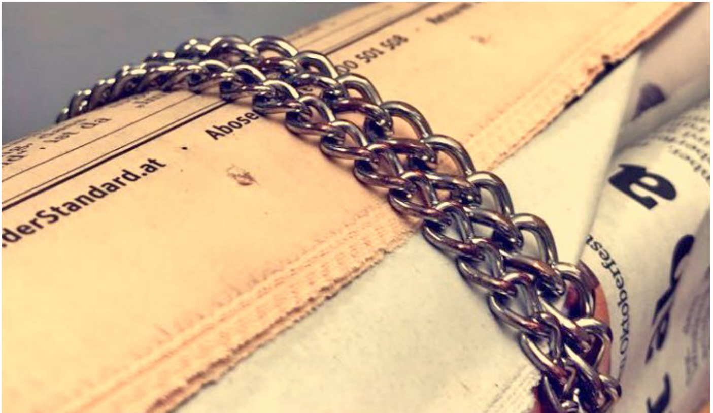
Medien in Ketten – das ist die Situation in Diktaturen.