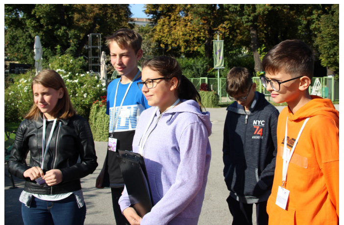
Bei unserer Umfrage auf der Straße.