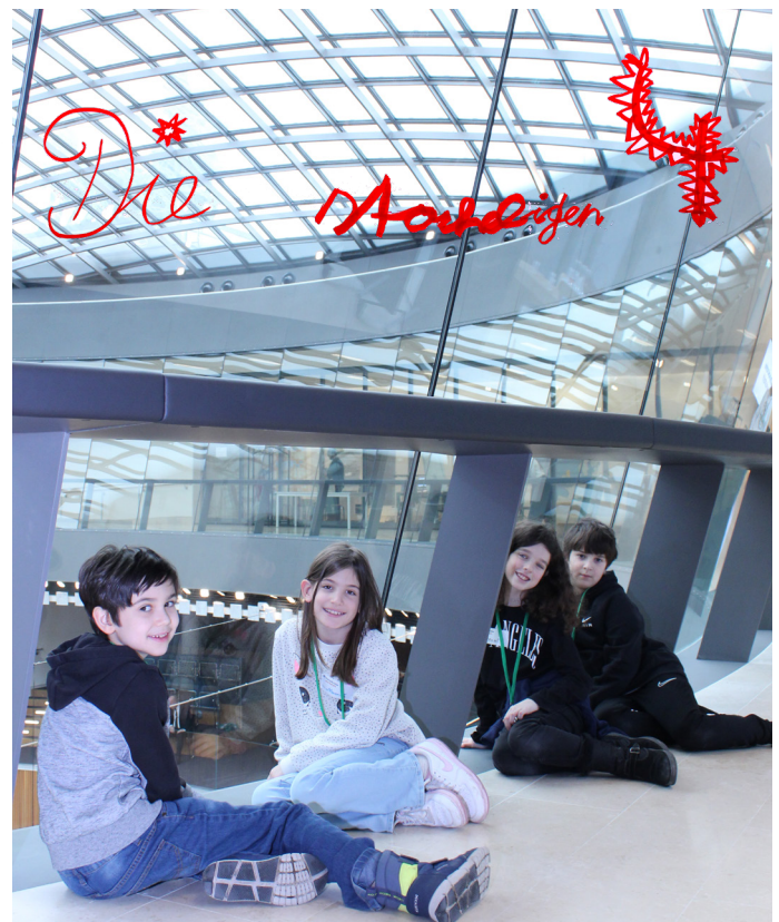
Wir sind „Die stacheligen 4“!

Fernsehen, Internet, Radio, Zeitung. Das sind Medien. Sie beeinflussen unser Leben. Weil: durch die Medien erhalten wir Informationen. Wir können uns informieren! Wir informieren uns z. B. über Gesetze. Aber warum informieren wir uns über Gesetze? Weil wenn man sich nicht informiert, kann es unabsichtlich passieren, dass man ein Gesetz bricht! Wenn man ein Gesetz bricht, dann kann es sein, dass man eine Geldstrafe bekommt oder ins Gefängnis muss. „Unwissenheit schützt vor Strafe nicht“. Dieses Sprichwort bedeutet, dass Leute, die ein Gesetz brechen und dann sagen, dass sie das nicht bemerkt haben oder nicht davon wussten, trotzdem eine Strafe zahlen müssen. Zum Beispiel, wenn man zu schnell mit dem Auto fährt.