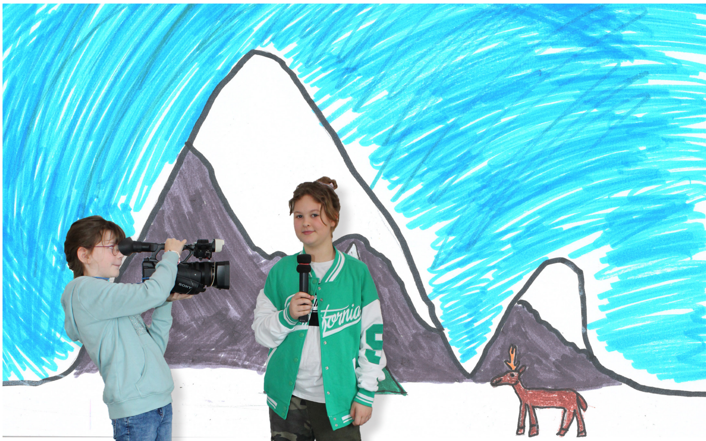
Eine Korrespondentin oder ein Korrespondent berichtet meist selbst live vor der Kamera.