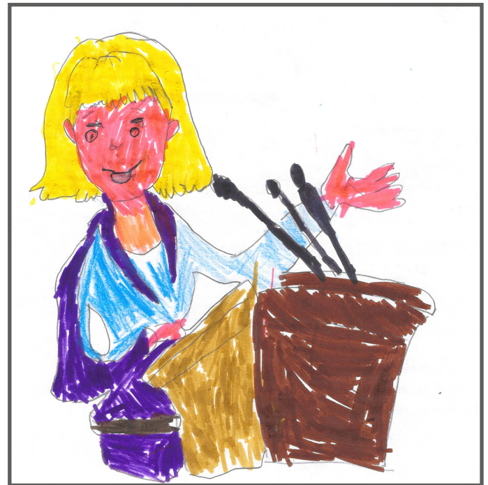
Alle können in einer Demokratie ihre Meinung sagen.

Chance, mitzubestimmen! Die Wahlen müssen fair für alle sein. Die Bürger:innen bestimmen durch solche Wahlen, wie wir schon gesagt haben, mit. Das finden wir gut!