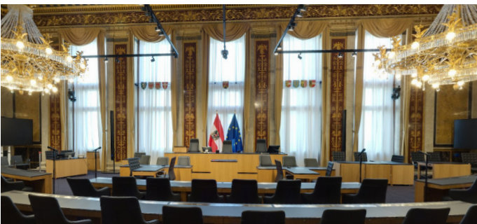
Im Bundesratssitzungssaal trifft sich der Bundesrat.