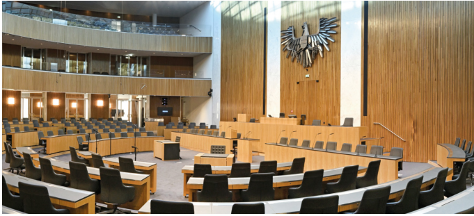
Hier trifft sich der Nationalrat.