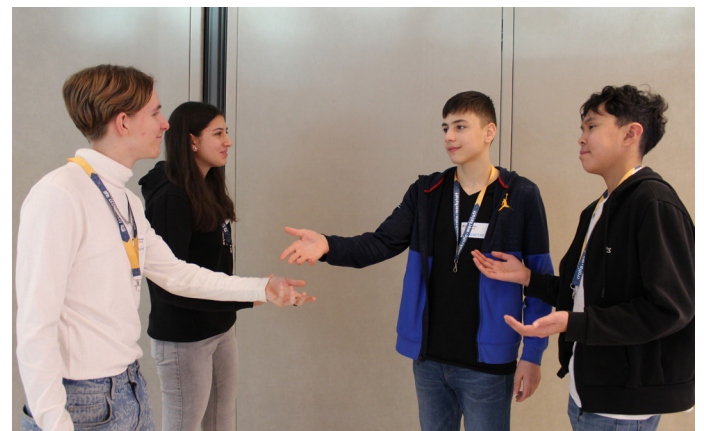
Auch durch die Teilnahme an Diskussionen können wir unsere Meinung teilen und dadurch mitbestimmen.