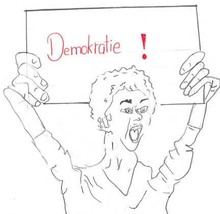
Demonstrieren ist eine der Möglichkeiten für alle Personen, auch unter 16 Jahren, mitzubestimmen.