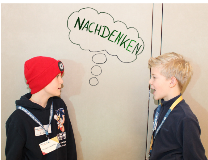
Demokratie heißt: Nachdenken und miteinander reden ...