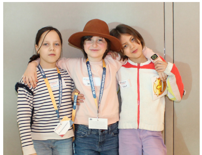
Wir können uns für andere einsetzen!