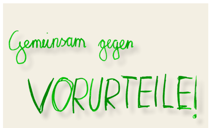
Egal, ob jemand einen Hut trägt, wie alt man ist, ob reich oder arm ... Jede:r darf eine eigene Meinung haben und niemand soll ausgeschlossen werden!