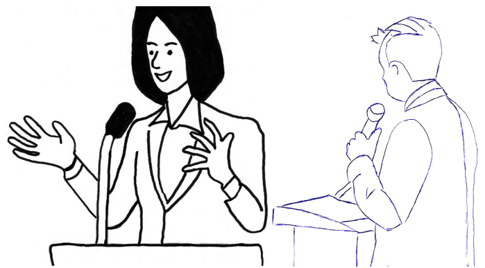
Politikerinnen und Politiker halten eine Rede im Parlament.

nett in Empfang genommen und uns wurde eine angenehme Atmosphäre geschaffen. Wir fühlten uns wohl und obwohl das Gebäude sehr groß ist, haben wir uns in unserem Bereich gut zurechtgefunden. Wir würden einen solchen Besuch jeder und jedem empfehlen, da es sehr eindrucksvoll und eine doch einmalige Erfahrung darstellt.