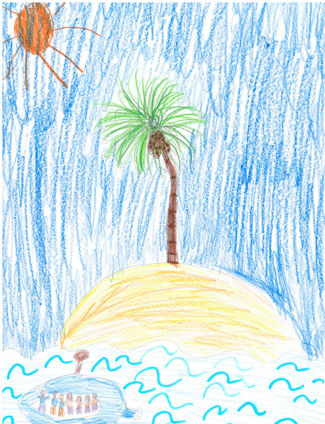
1: Eines Tages kamen sieben Kinder auf eine Insel.

niemand ausgeschlossen und es ging jeder und jedem gut. Damit es fair und demokratisch ist. Da hörte man ein Kind rufen: „Leute, können wir jetzt bitte essen! Ich habe Hunger!“ Das ist die Geschichte der Vielfalt der Geschmäcker auf einer Insel.