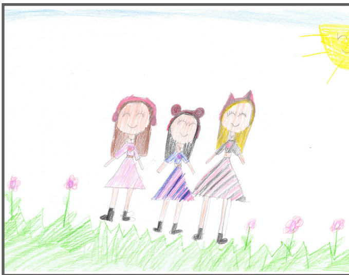
Man sollte lieber alle mitspielen lassen!