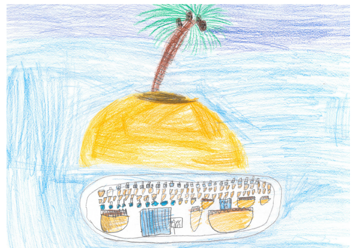
2: Da kam ein großes Boot mit tausend Döner und Ayran.