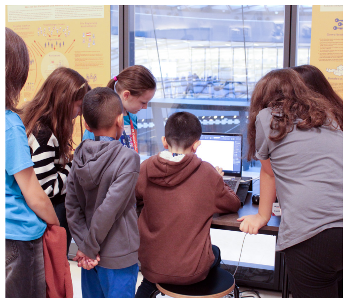
Wir bei der Arbeit: Das ist Teamwork!

Wir erklären jetzt, was Gemeinschaft für uns heißt: Gemeinschaft heißt, nett sein, respektvoll sein und zusammenhalten. Dazu gehört auch, anderen zu helfen. Jede und jeder braucht mal Hilfe. Deswegen ist Zivilcourage so wichtig. Zivilcourage heißt nämlich mutig sein, wenn jemand Hilfe braucht, damit man gut in einer Gemeinschaft zusammenleben kann. Aber wie kann man Zivilcourage zeigen? Man kann stopp sagen, wenn man sieht, dass jemand zum Beispiel wegen eines bestimmten Merkmals ausgeschlossen wird. Manchmal ist