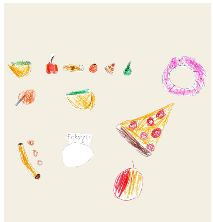
4) Zum Glück gibt es auf der Insel viel zu essen. Jede und jeder darf essen, was er oder sie will. Niemand wird ausgeschlossen.