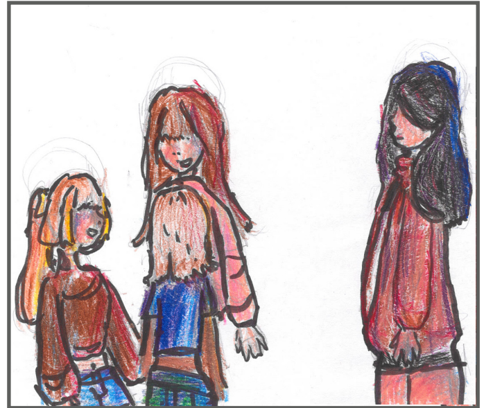
Wenn man ausgeschlossen wird, fühlt sich das nicht gut an und tut weh. Dann ist man traurig.

Zusammen ist es einfacher, mutig zu sein. Die Gemeinschaft macht uns da stärker!