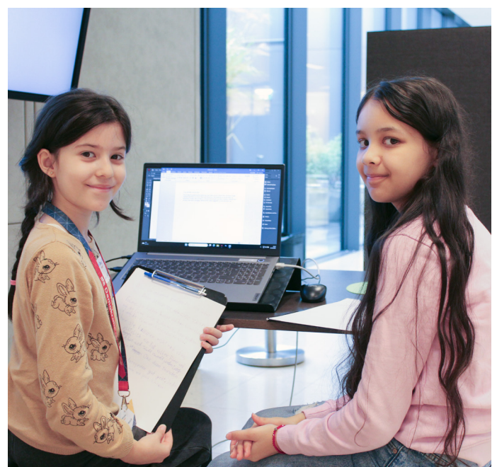
Teamarbeit zum Thema Vielfalt.

Sieben Kinder machten sich auf eine Reise zu einer Insel. Als sie ankamen, packten sie ihre Sachen aus. Dann sahen sie eine schöne Palme. Sie hatten Hunger und dann bemerkten sie auf der Palme viele Kokosnüsse. Dann kletterten sie auf die Palme, um Kokosnüsse zu holen. Aber sie schafften es nicht, bis ganz nach oben zu klettern. Plötzlich kam ein Boot voller Döner und Ayran. Manche Kinder sagten: „Mhhh lecker.“ Aber andere meinten: „Nein, ich möchte nicht jeden Tag Döner essen, ich möchte auch mal Pizza essen!“ Da hieß es: „Nein, jeder muss Döner essen!“ Zum Glück sagte ein Kind: „Stopp,