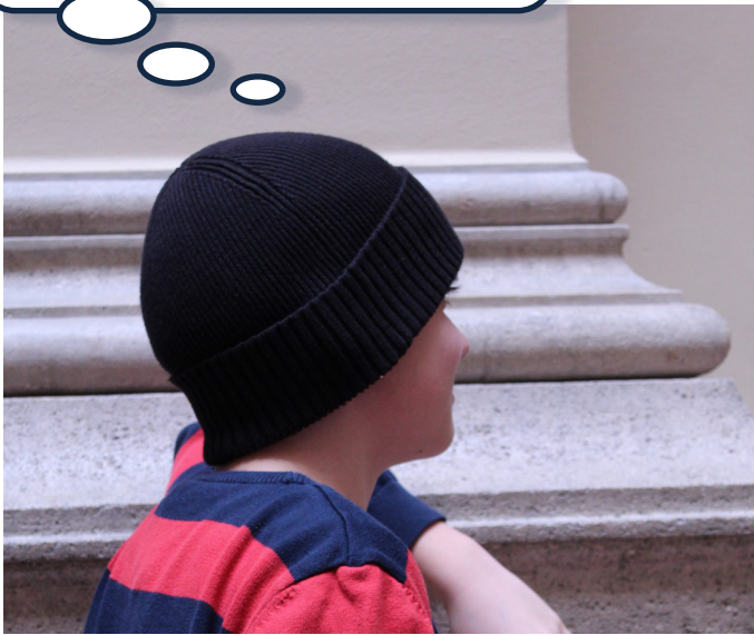
Hier hat jemand Vorurteile gegenüber einem neuen Schüler.

Leute mit schwarzer Kleidung sind immer solche Möchtegern-Gangster!