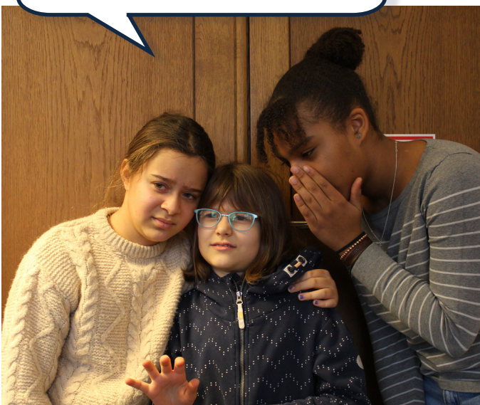
Hier wird der Neue ausgegrenzt.

Der hat uns gerade noch gefehlt. Wir sollten uns von ihm fernhalten.