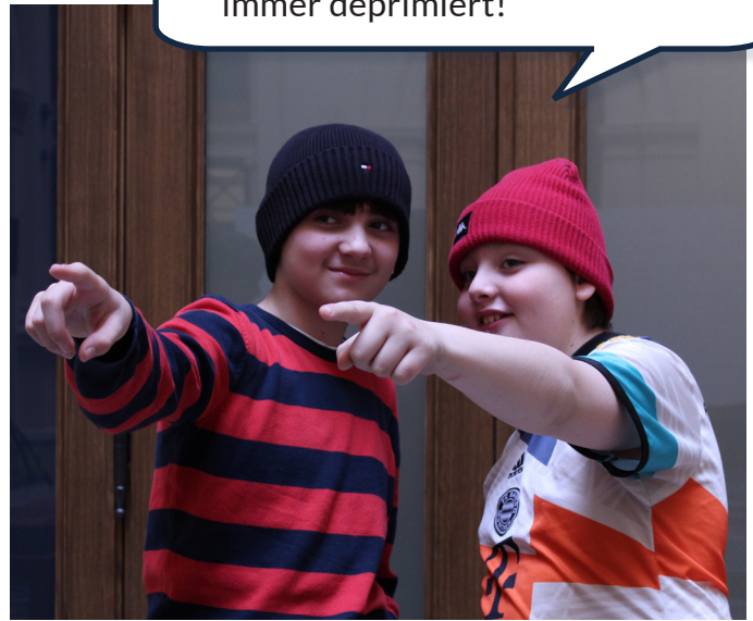
Hier machen sie ihn runter.

Schaut euch diesen Emo an, ganz schwarz angezogen und immer deprimiert!