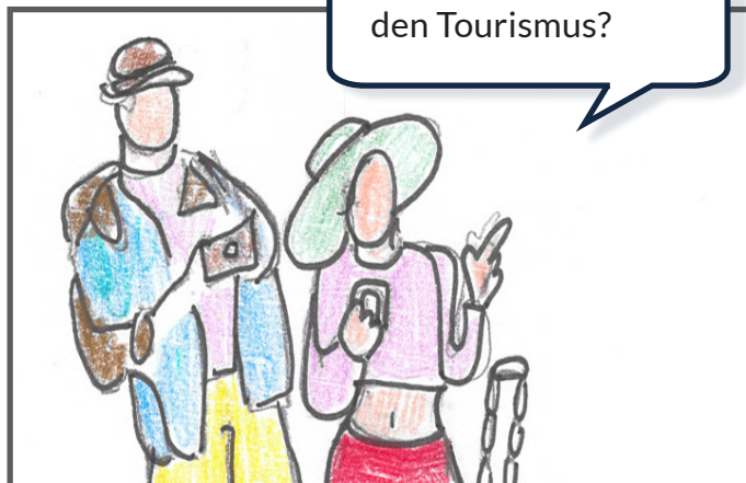
Manche von uns arbeiten eventuell künftig im Tourismus.

Sehr! Gemeinsame EU-Regelungen und der Euro machen vieles leichter.