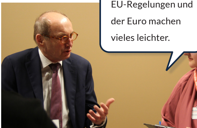
Auch wenn wir uns z. B. verletzen, gilt in EU-Ländern unsere e-card.

Sehr! Gemeinsame EU-Regelungen und der Euro machen vieles leichter.