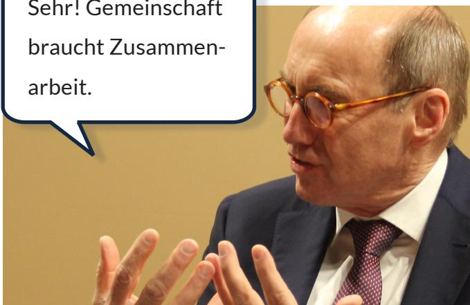
Europa soll laut Herrn Karas unabhängiger werden von Trump oder Putin. Europa soll selbstbewusster sein!

Sehr! Gemeinschaft braucht Zusammenarbeit.