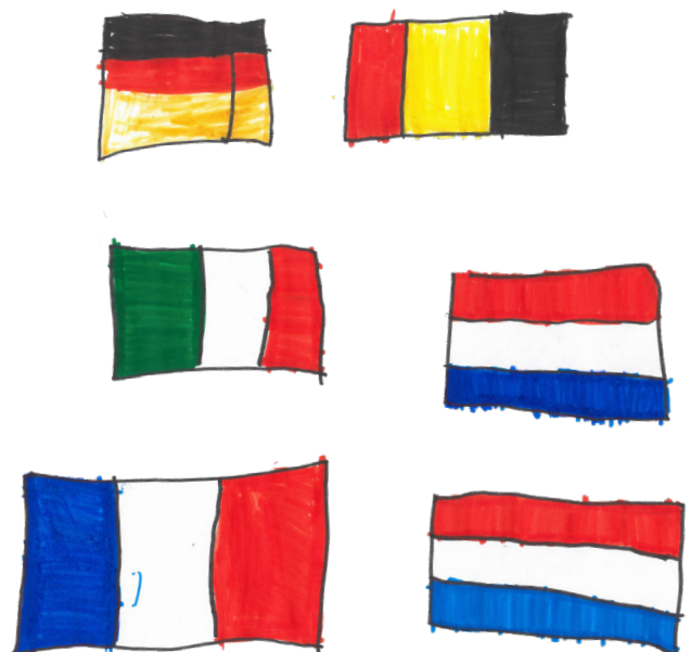
Das sind die sechs Gründungsländer der EGKS.

Wir erzählen euch heute etwas über die Geschichte der EU. Wie hat denn alles begonnen? Nach dem Zweiten Weltkrieg lag Europa in Schutt und Asche. Den Menschen ging es sehr schlecht, weil sie hungrig, durstig und arm waren. Deshalb wollten sie Freiheit und Frieden. Der französische Außenminister Robert Schuman und sein Freund Jean Monnet hatten eine Idee, damit die Länder in Europa gut zusammenleben können. Gemeinsam mit Frankreich, Deutschland, Italien, Belgien, den Niederlanden und Luxemburg wurde im Jahr 1951 die Europäische Gemeinschaft für Kohle und Stahl