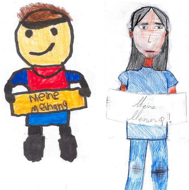
Hier sieht man Menschen, die protestieren: „Auch wir sind Menschen! Wir haben Rechte! Meine Meinung!“ steht z. B. auf ihren Schildern. Wir erfahren davon auch im Internet.